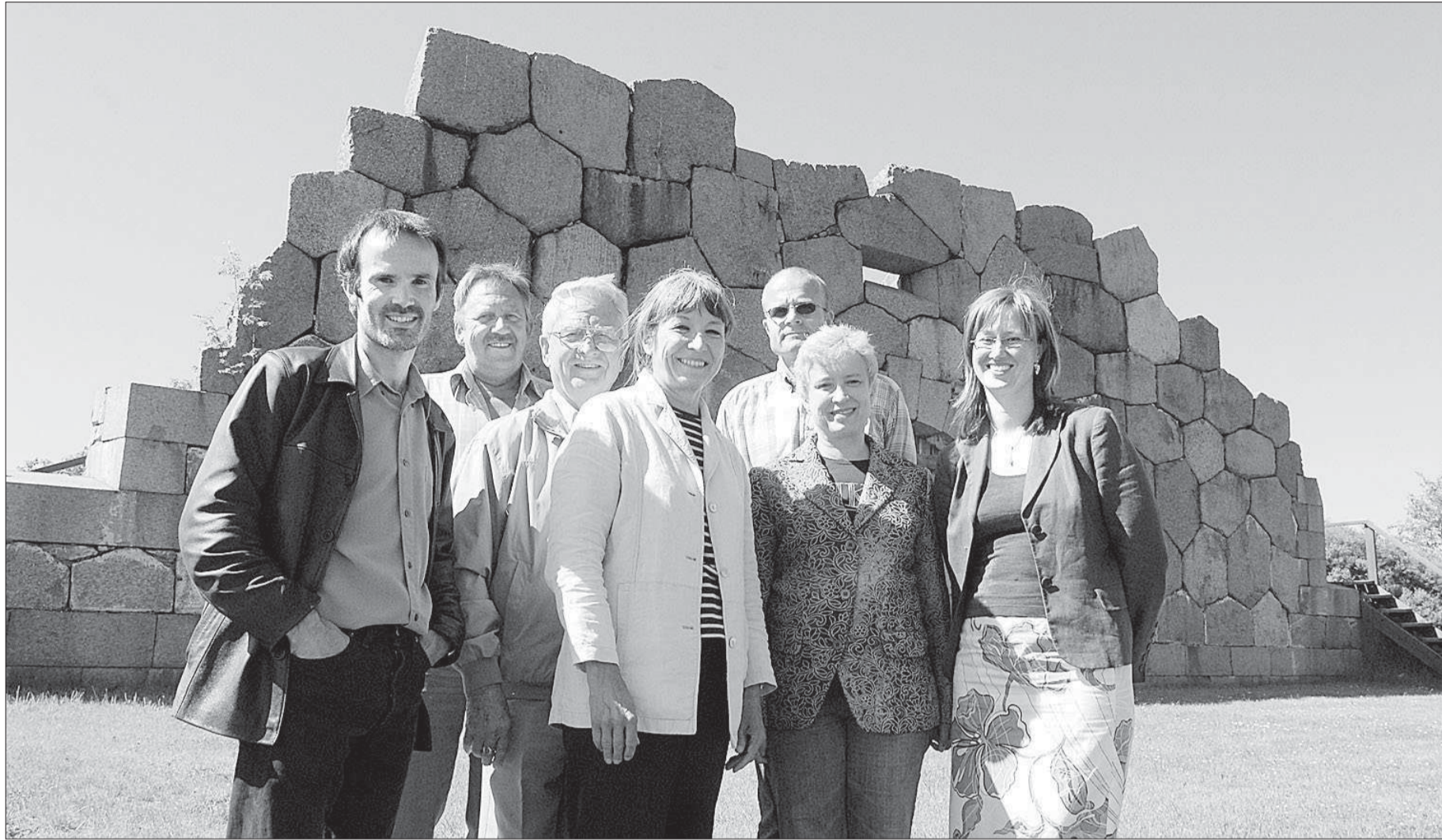
Blåser på? Bomarsundskommittén på bilden skall om några veckor komma med sin mellanrapport om vad den tycker man kan göra för att lyfta Bomarsund turism. Men näringsministern har redan sågat det som föreslås.