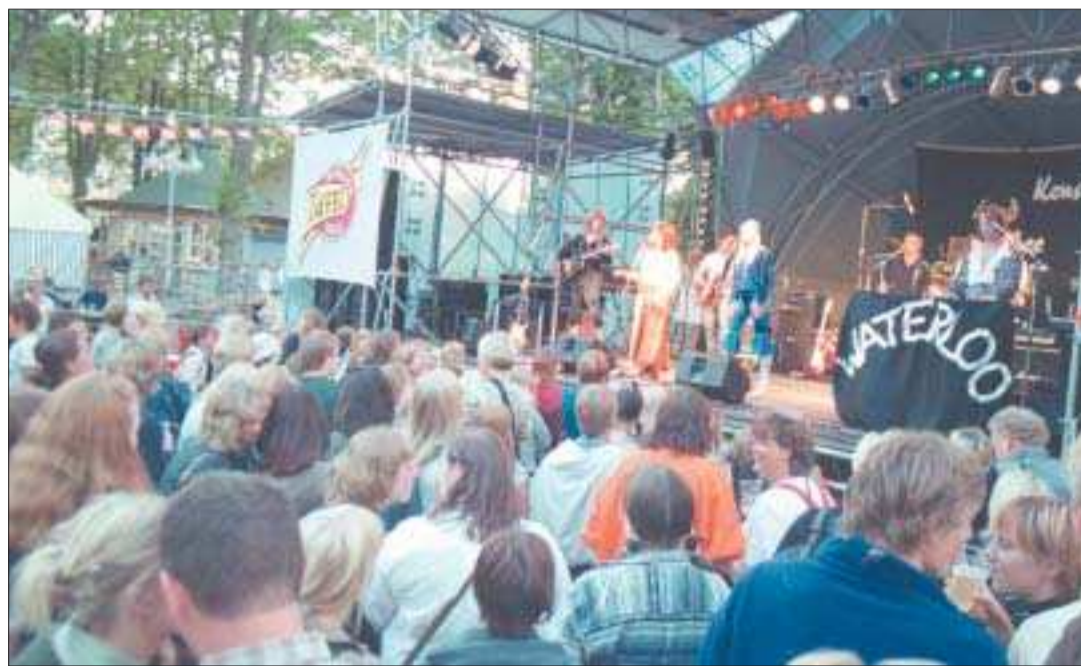
Abba-show. "Dessutom är ju Mariepark anpassad färdigt för festivaler varför vi också bör bevilja bolaget ett evenemangsbidrag så att det går att bedriva Rockoff på Torget med en mobil anläggning." skriver kansliministern. Bilden från Rockoff på Torget är från 1999.

Uthyrd i andra hand eller inte kommer staden självklart att få kostnader för Mariepark. De kostnaderna tycker jag vi får lov att ta under stadsplaneprocessen. Staden har ett ansvar för att beredningen och behandlingen av ärendet dragit ut så länge på tiden.