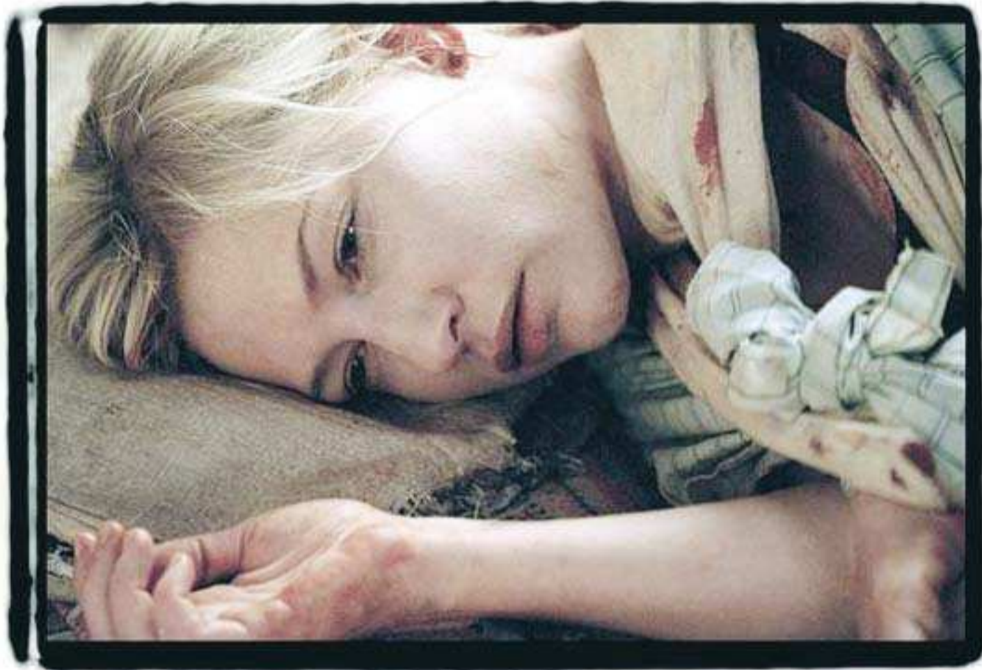
En i ensemblen. Cate Blanchett är affischnamn i Babel, men handlingen ger lika mycket utrymme till andra och mindre kända skådespelare.