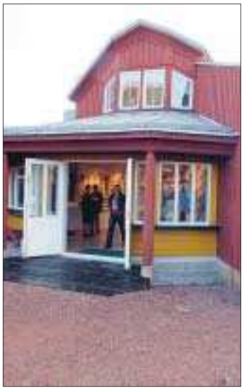
Grindstugan vid Kastelholms slott är ett av de företag som turistförbundet samarbetar med.