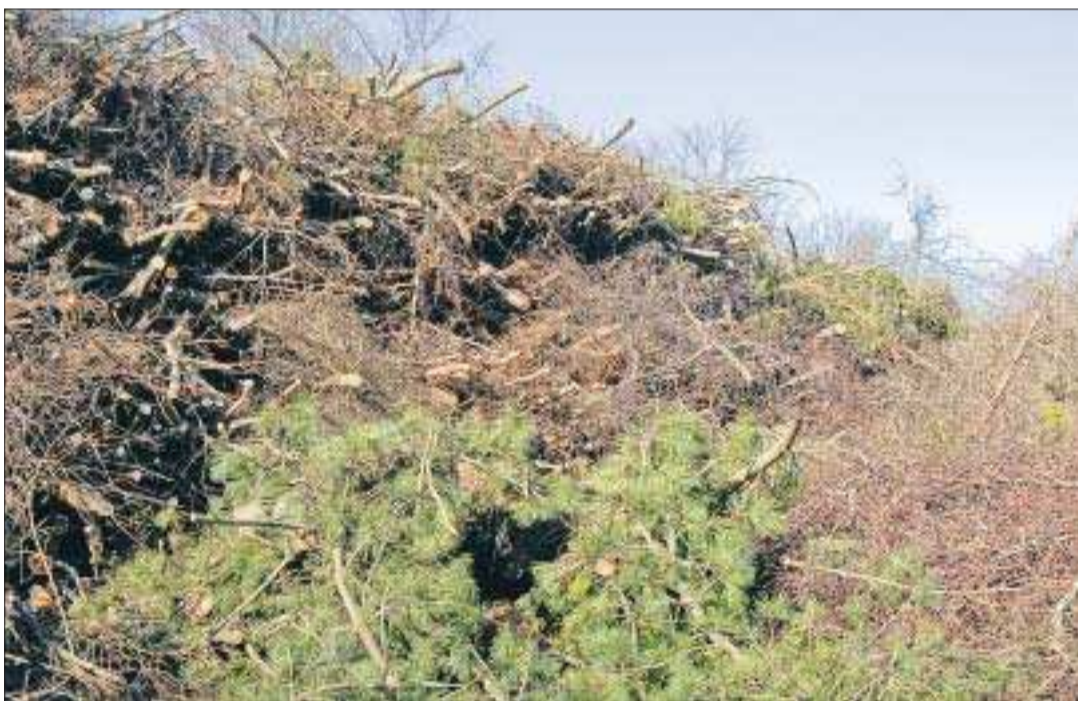
Blivande flis. Högen med ris på stadens uppsamlingsplats på Espholm är imponerande. Och den växer. Den skall så småningom bli till flis. Det buskar som ligger nersågade längs själva vägen är landskapets och förs antagligen till landskapets uppsamlingsplats i Jomala Torp.

– Jag kn inte säga hur det ser ut längs Järsövägen just