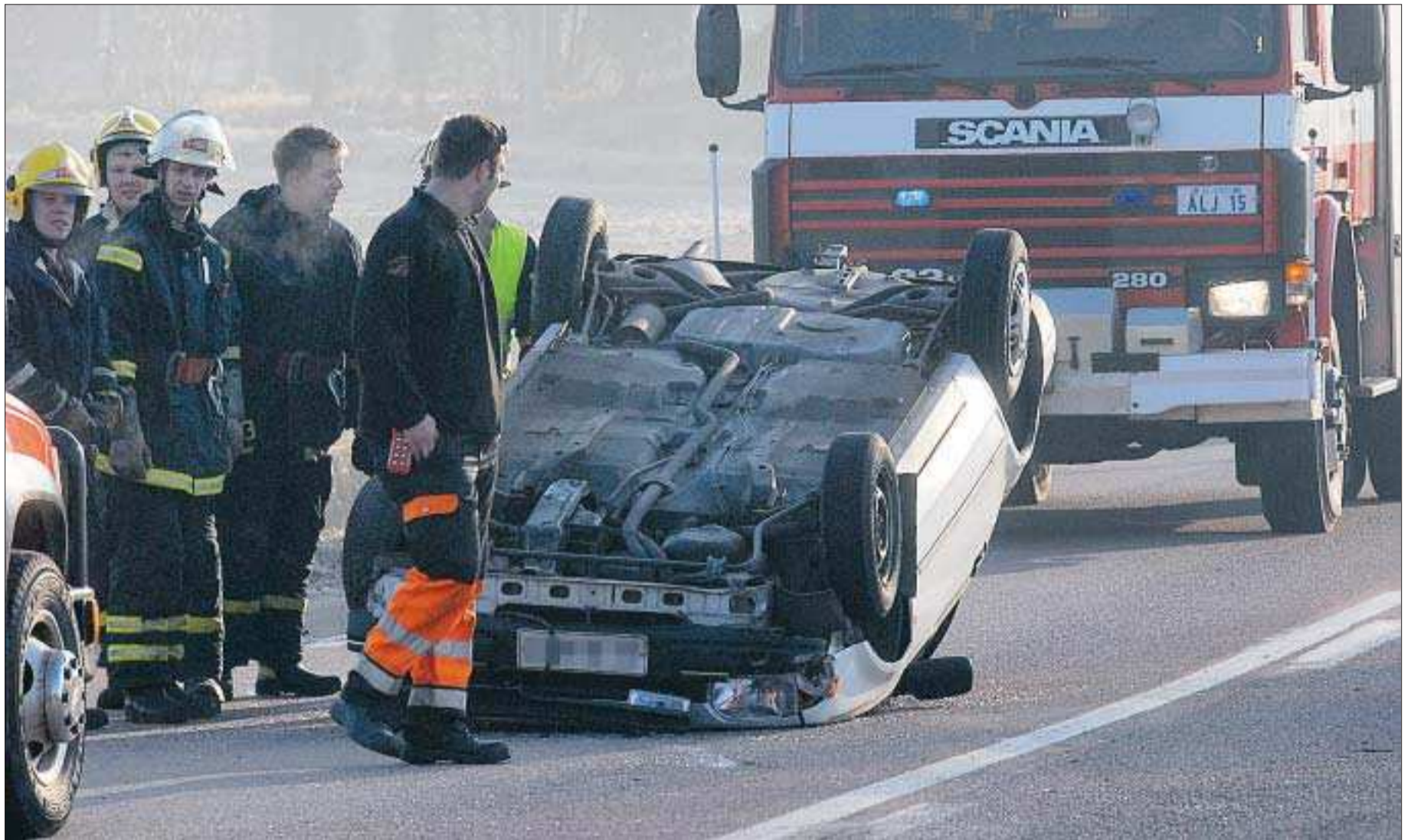
Aldrig bil igen. Bilen voltade och blev liggande på taket mitt i körfältet.