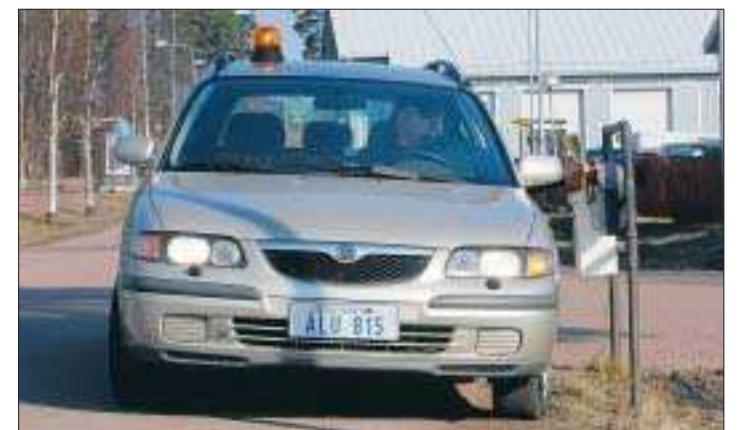
På vänster sida. Med en vänsterstyrd bil behöver man ibland köra över på fel sida av vägen för att nå postlådorna. Enligt den nya trafiklagen som trädde i kraft 1 mars måste alla fordon som av någon anledning behöver köra över på fel sida av vägen märkas med en gul varningslampa.

taket är det tillåtet att köra över på vänster sida, berättar Jansson. Samtidigt påpekar han att man förstås ändå bör hålla sig på rätt sida av vägen så mycket som möjligt.