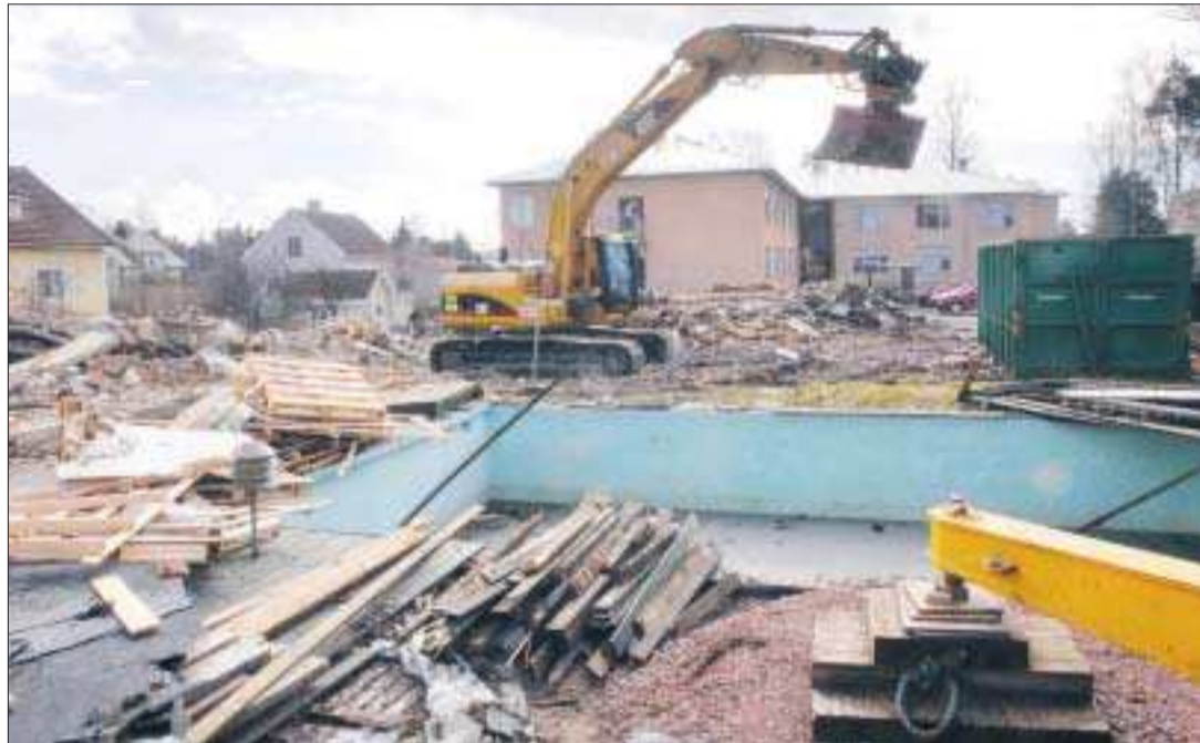
Byggnader rivna. Allbygg har rivit restaurangen som fanns i anslutning till Strandnäs Hotell samt bostadshuset som stod intill.

För ett par år sedan köpte Allbygg Strandnäs hotell och restaurang. Nu har krävskoporna och schaktmaskinerna gjort sitt. Kvar står bara ett snart nyrenoverat hotell och en tom yta.