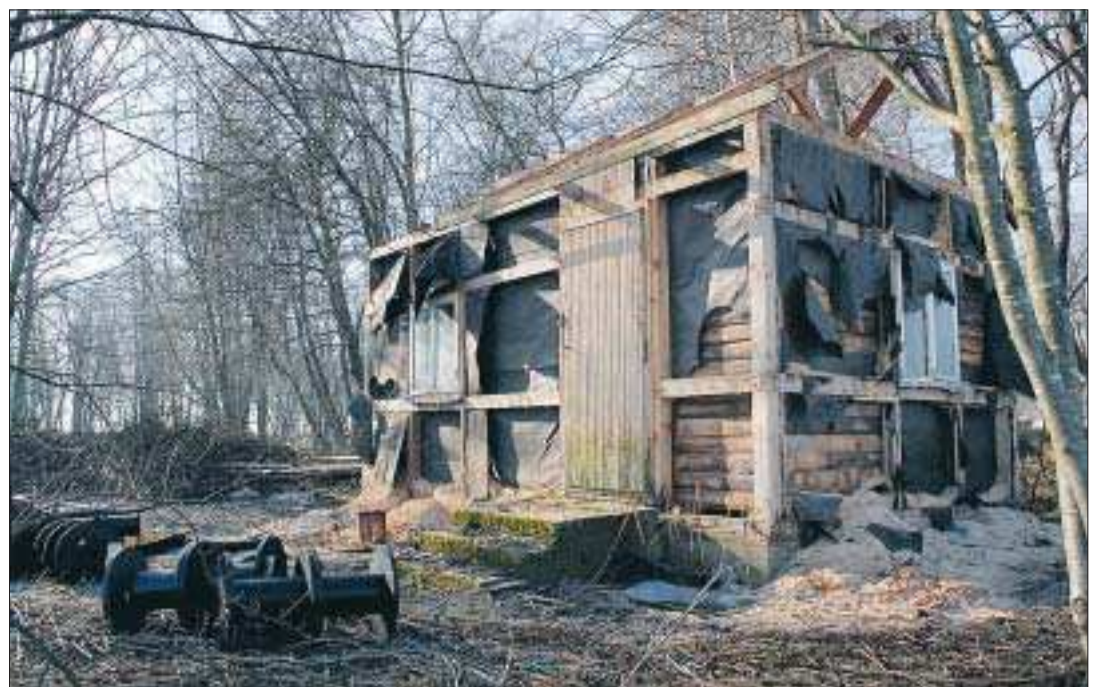
Plockas ned. Den lilla stugan vid Nabben i Mariehamn håller på att försvinna.