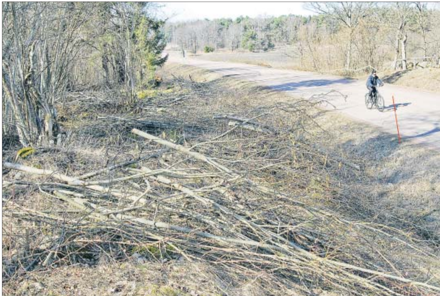
Vägröjning. Ungbjörkar, hassel och buskage av annat slag har putsats bort längs Järsövägen för att ge friare sikt. En del av ungräden som tas bort växer rätt långt från vägen, men tas bort ändå. Bilden är tagen strax före vägskalet in till Espholm.