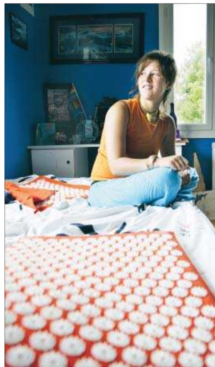
Över 6.000. Så många är plastpiggarerna på mattan. De är ordnade i runda "knappar" med 27 piggar i varje. Varje matta har 230 sådana knappar.