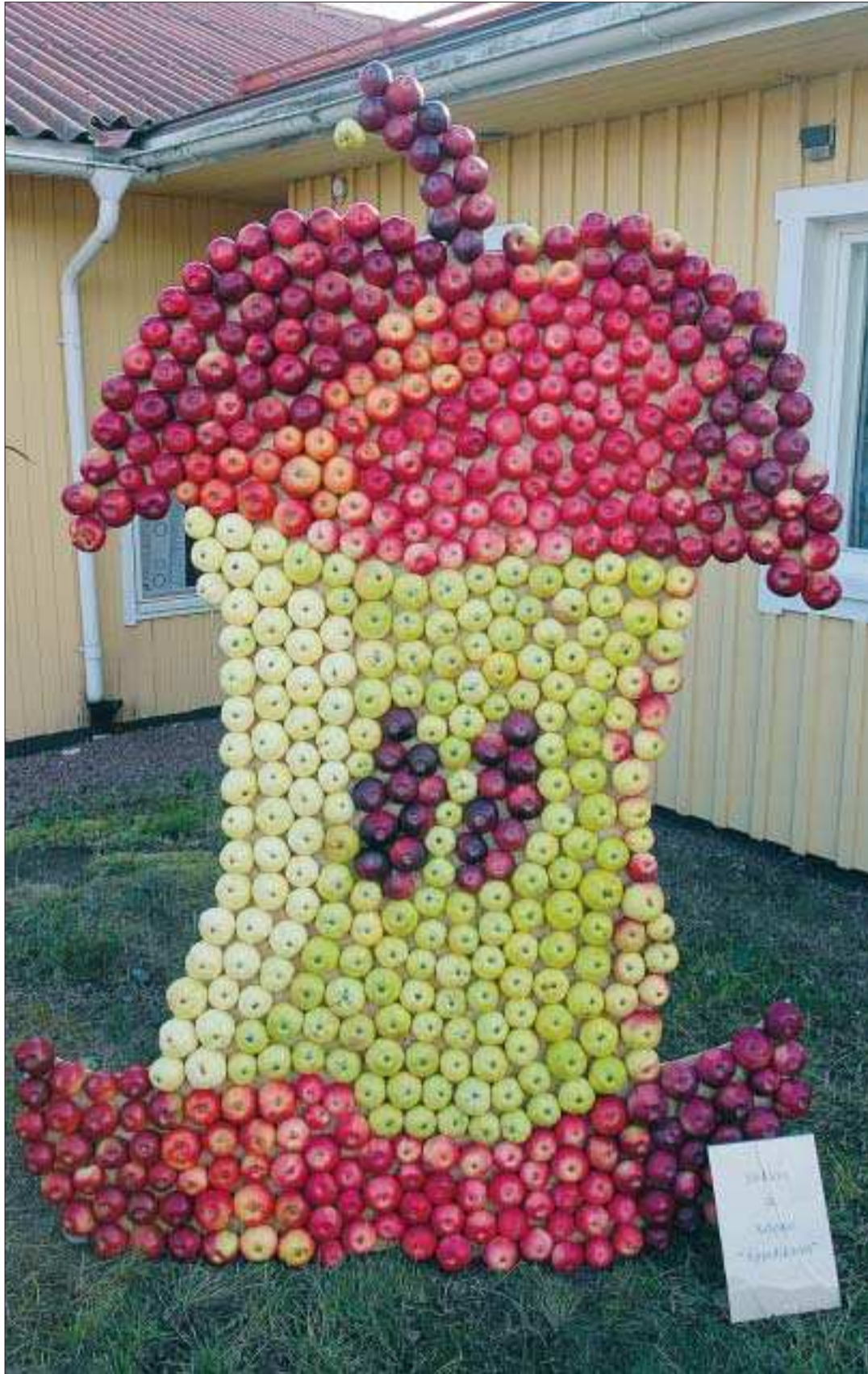
Grann skörd. Det säljs en hel del frukt och grönsaker under skördefesten. Den här äppelskulpturen tillverkades vid Ålands försöksstation inför en tidigare skördefest.