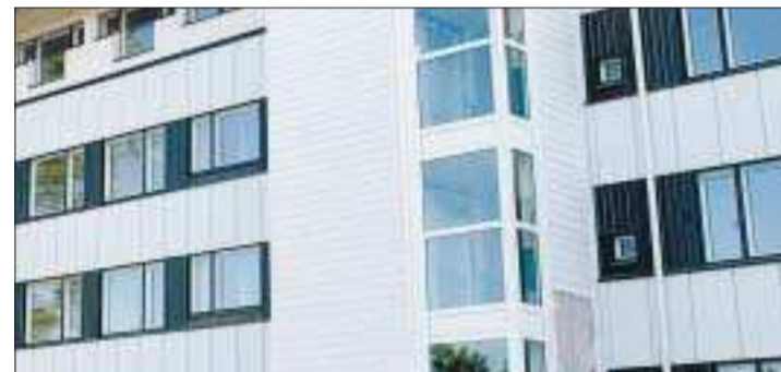
Olika stöd. För byggandet av hyresbostäder föreslår arbetsgruppen tre olika kategorier av stöd.

– Nu flyter pengarna runt på internationella börser. Det skul-