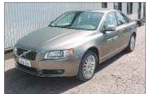
Volvo S80 2,5 Summum -07

6000 km, s+v-däck på alu.fälgar, ECC, backvarnare bak, ljus helläderklädsel, elmanövrerat förarsäte, Bi-Xenon ljus, Bluetooth-system, regnsensorer, farthållare, färd dator, tränlägg.