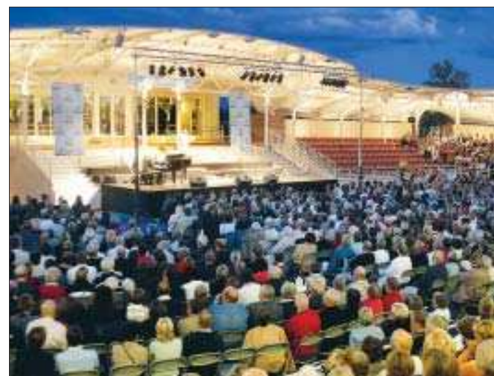
Succé. Publiken uppskattade den maffiga konserten då den åländska sångarelliten uppträdde ute på Andersudde för den marina miljön.