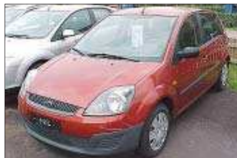
Ford Fiesta 1,3 Ambiente 5-d -07

300 km, ny utställningsbil utrustad med bl.a. ABS, luftkonditionering, Ford audio 6000 CD, dubbla krock-kuddar fram, sidokrock-kuddar fram m.m., metallfärg.