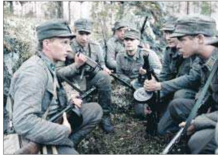
Bioförslag. "Det så kallade kk-huset, varför har man inte en biograf i detta hus om det nu ska vara ett kulturhus, för vad är inte kultur om inte film?" skriver insändarskribenten. Bilden är ur filmen "Framom främsta linjen".