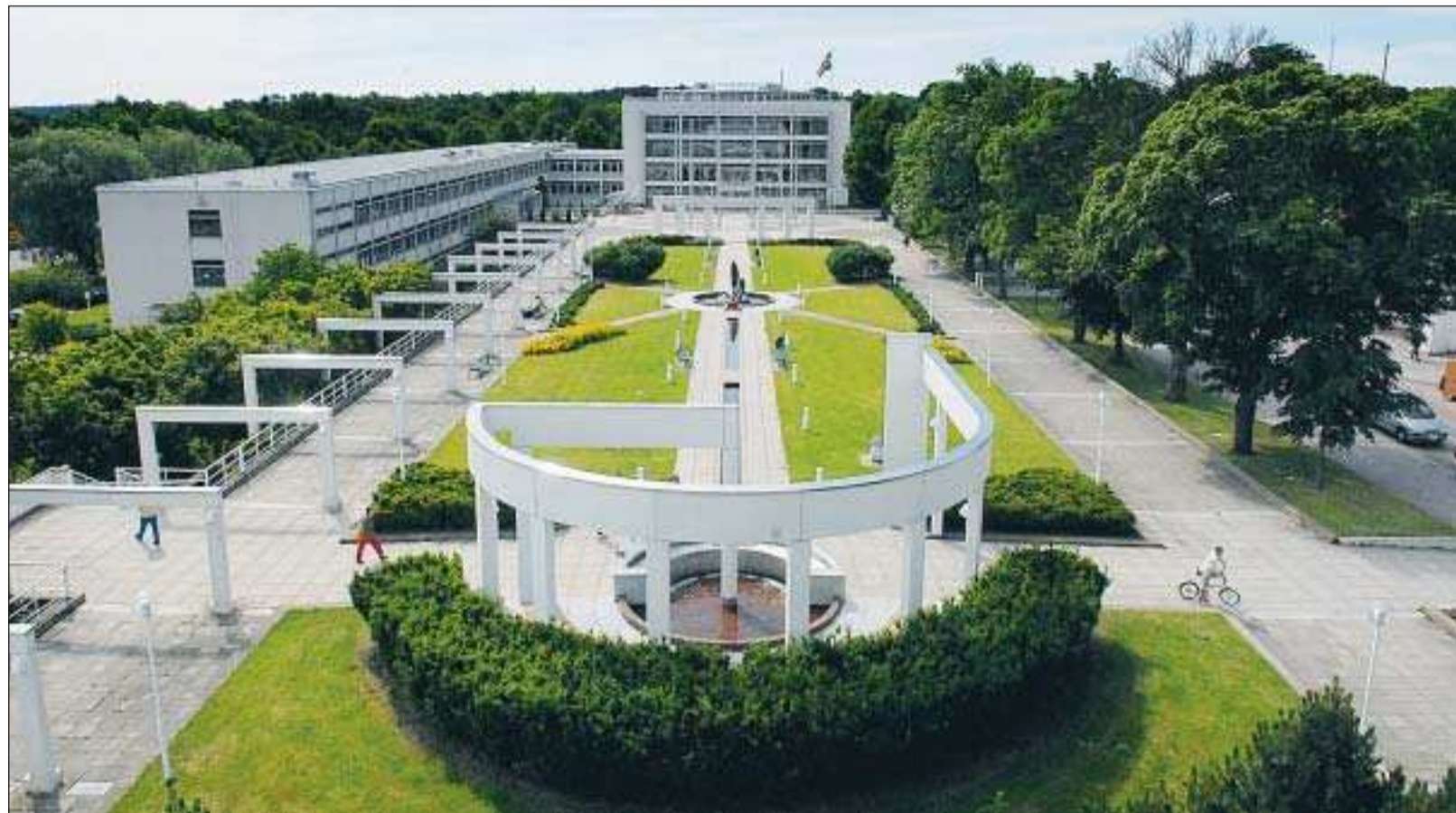
Vägen till makten. Första steget till makten är taget för de 245 ålänningar som ställer upp i lagtingsvalet.