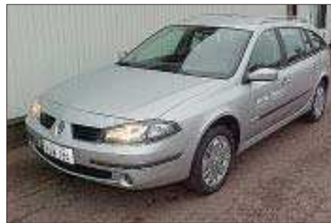
Renault Laguna 2,0 STW Conquest -06

1.000 km, s+v-däck, radio-cd, aut. Klimatanläggning, ESP, farthållare, färd dator, elhissar fram och bak, elspeglar, dimljus fram, rails m.m.