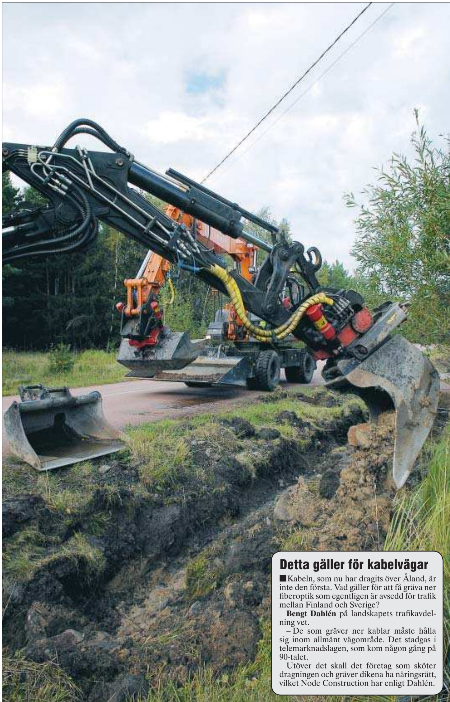
Det grävs. Snart finns det ytterligare en fiberkabel i den åländska marken. Bolaget IP Only i Uppsala knyter ihop sina nät i Sverige och i Finland med kabeln över Åland. Bilderna är tagna i Bertbyvik.

Det här är inte den första kabeln som dras över Åland. Robert Cserhalmi förklarar att det är efterfrågan som avgör hur många kablar det blir.