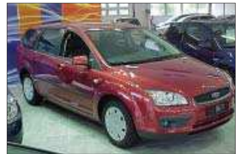
Ford Focus 1,6 Trend Wagon -07

200 km, ny utställningsbil utrustad med bl.a. ESP, Ford audio 6000 CD, dubbla krock-kuddar fram, sidokrock-kuddar, krock-gardiner m.m., metallfärg.