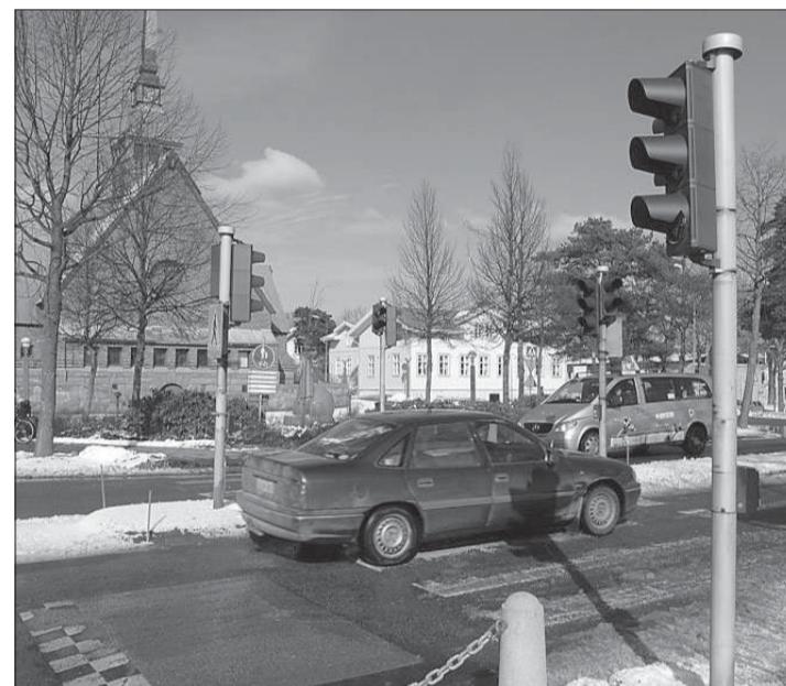
Smalt och upphöjt. Smala körbanor, dubbelt så bred refuge, en upphöjning på 10 centimeter och inga trafikljus är det som föreslås för övergångsstället vid kyrkan i Mariehamn.

Tekniska nämnden har möte i kväll och informeras då av Kai Söderlund om åsikterna