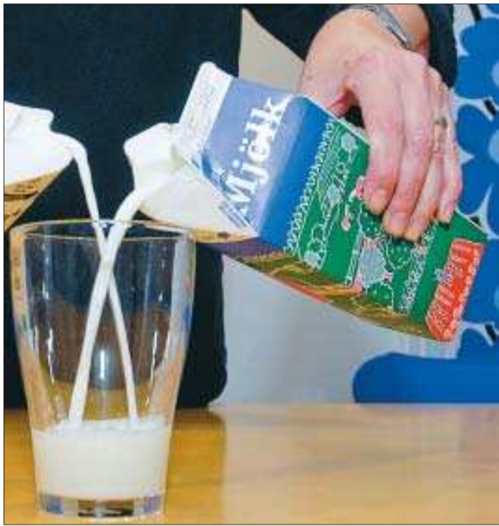
Går upp. Priset på mjölk stiger.