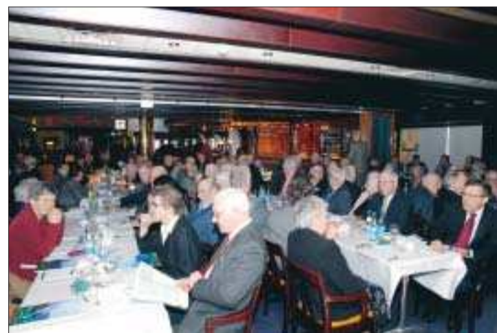
Fick fördel? Kan de här aktieägarna som var närvarande vid Ålandsbankens stämma anses ha fått en fördel i och med att det var där som styrelseordförande informerade om planerna på en extrastämma. Frågan har väckts efter stämman.

– I och med att det här meddelades i samband med stämman så har vi gett information om hur vi tänker. När vi sedan kallar till extra stämma går vi ut med börsmeddelande.