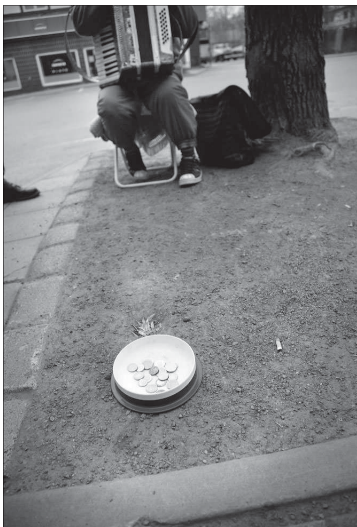
Behandlas illa. De romska minoriteterna diskrimineras bland annat på arbetsmarknaden i Rumänien, berättar socialdirektören.

Fri rörlighet hör till grundrättigheterna inom EU. Även