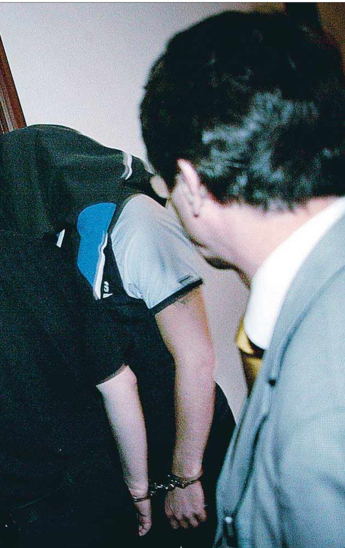
åtalade var på väg in in i salen i Stockholms tingsrätt.