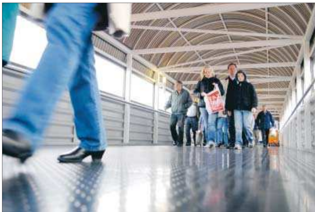
Steg framåt. Inom både passagerar- och fraktsjöfarten ser utsikterna för tillväxt goda ut.

– Antalet sysselsatta i det privata näringslivet på Åland stiger enligt vår prognos med