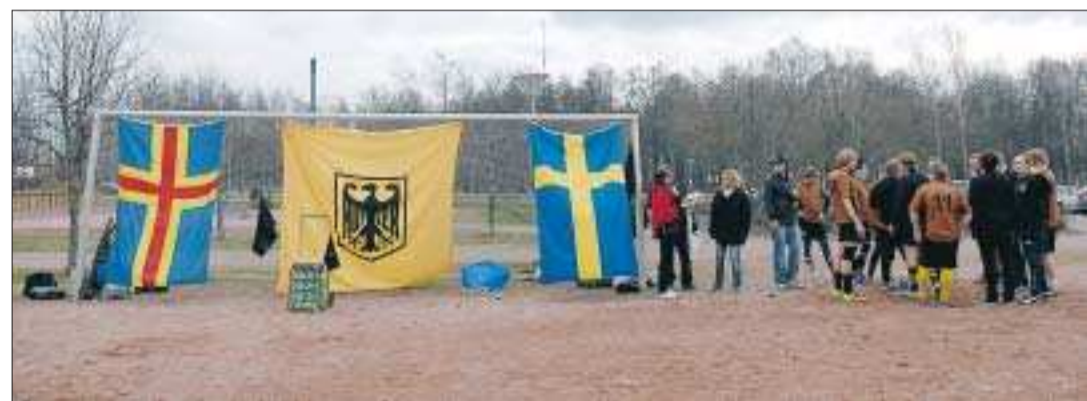
Let the gam begin. Hoyzer Boys emblem skrämde inte ålänningarna.