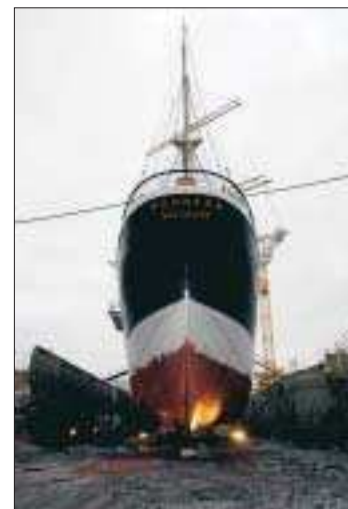
Pommern lämnar dockan i dag.

ANNIKA ORRE annika.orre@nyan.ax tfn 528 450