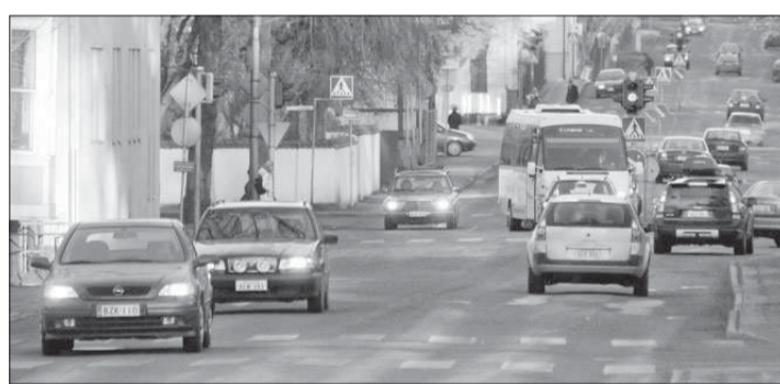
Tät trafik. "Vilka andra - fungerande - alternativ än egen bil har vi idag?" undrar insändarskribenten.

Det enda vettiga i motionen är förslaget om infartsparkeringar, i det fall dessa kombineras med en fungerande