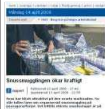
Rapports hemsida på söndagen.

Reparationerna av Pommern blev mer omfattande än man först räknat med och det krävdes tilläggsanslag från Mariehamns stad för att bekosta de nödvändiga åtgärderna. Det har också förts en debatt om hur Pommern ska bevaras i framtiden och där framfördes en tanke om att flytta henne upp på land, men inga beslut är fattade. (ms)