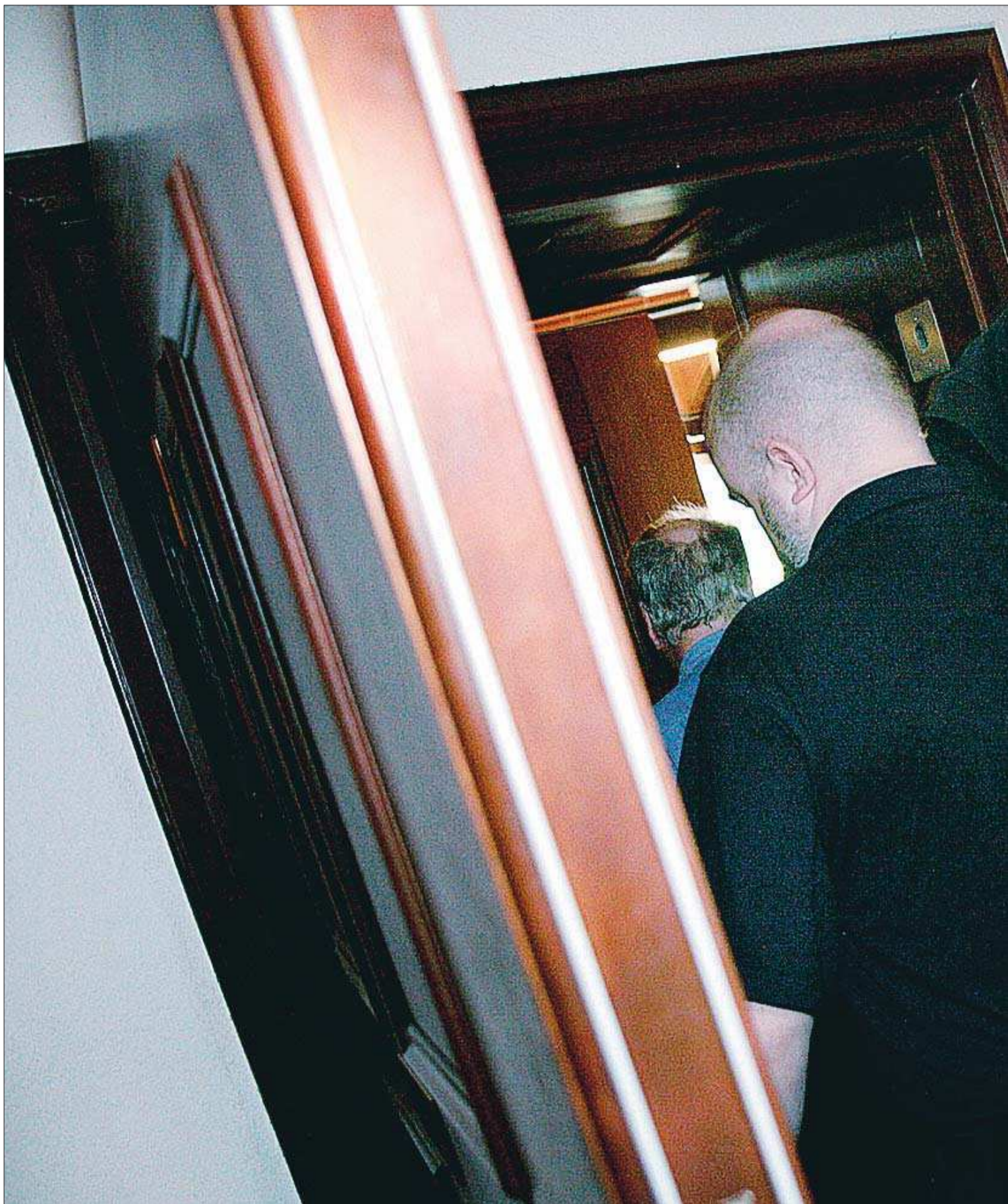
Rättegång. En person åtalades i Sverige i fjol för ÅAB-rånet. Domen väntar på att prövas i Svea hovrätt. Bilden togs när den

ANNIKA ORRE annika.orre@nyan.ax tfn 528 450