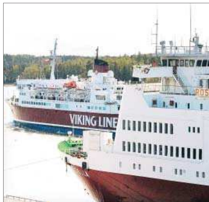
Trefaldigt större färja. Rosella är åtminstone om man ser till vikten nästan tre gånger så stor som Ålandsfärjan. Hon är väldigt populär dessutom. Fredagsturen från Kapellskär var helt slutsåld och flera turer i sommar förväntas vara lika populära.