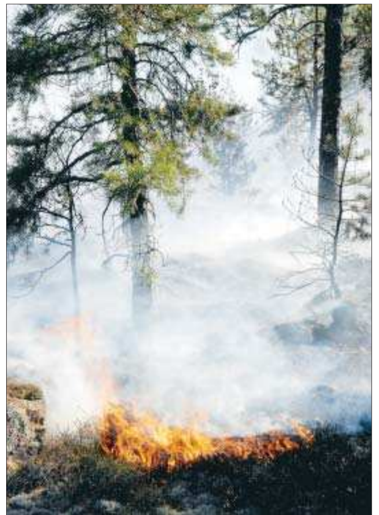
Snustorrt. Den snustorra marken gjorde att elden spred sig snabbt i vinden.