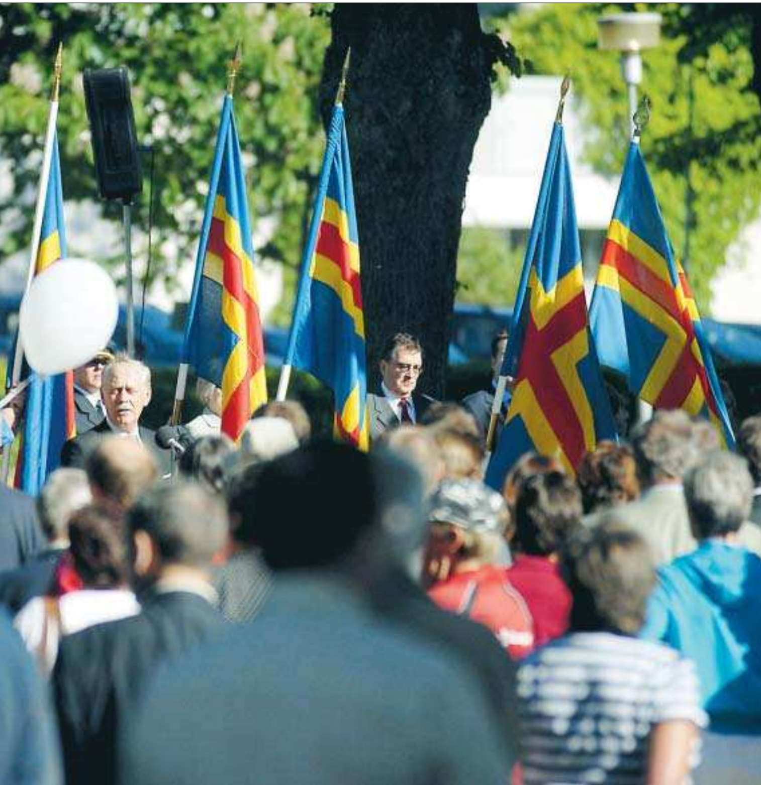
staty på självstyrelsedagen.