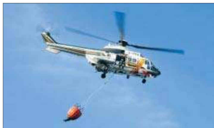
Vattenbomb. Superpuman från Åbo fick kallas in för att få branden under kontroll.