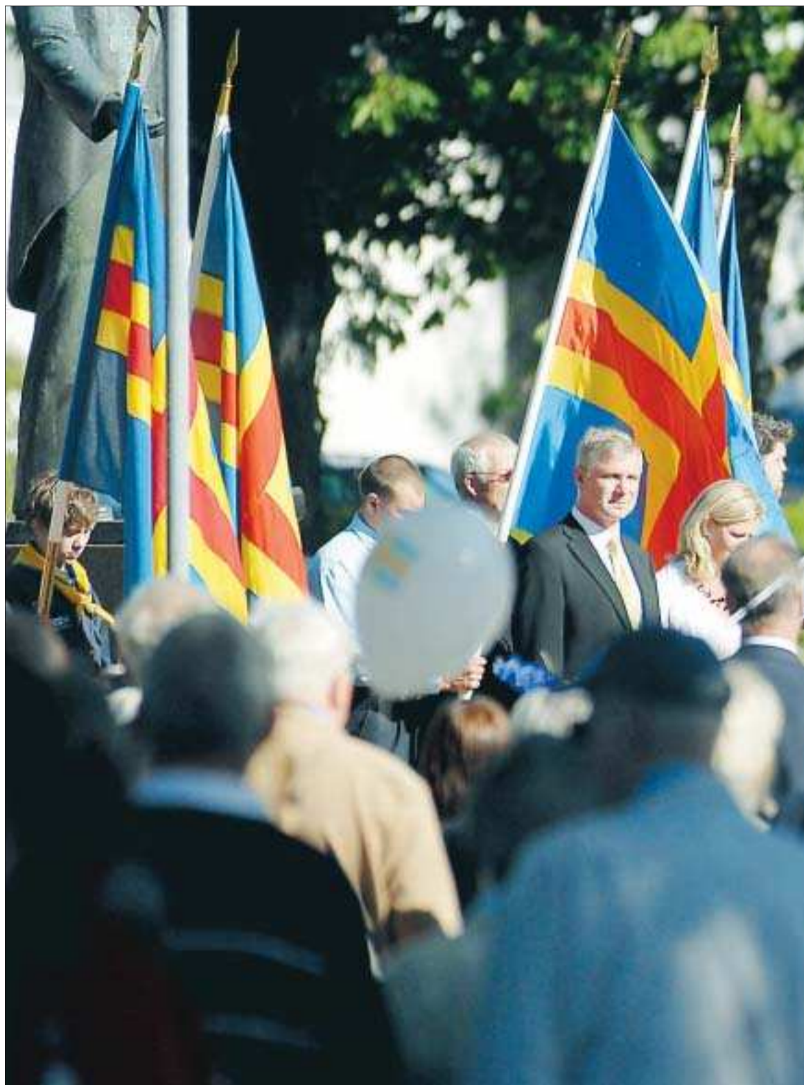
Ståtlig syn. Åländska flaggan vajade i vinden när det åländska lagtinget uppvaktade Julius Sundbloms