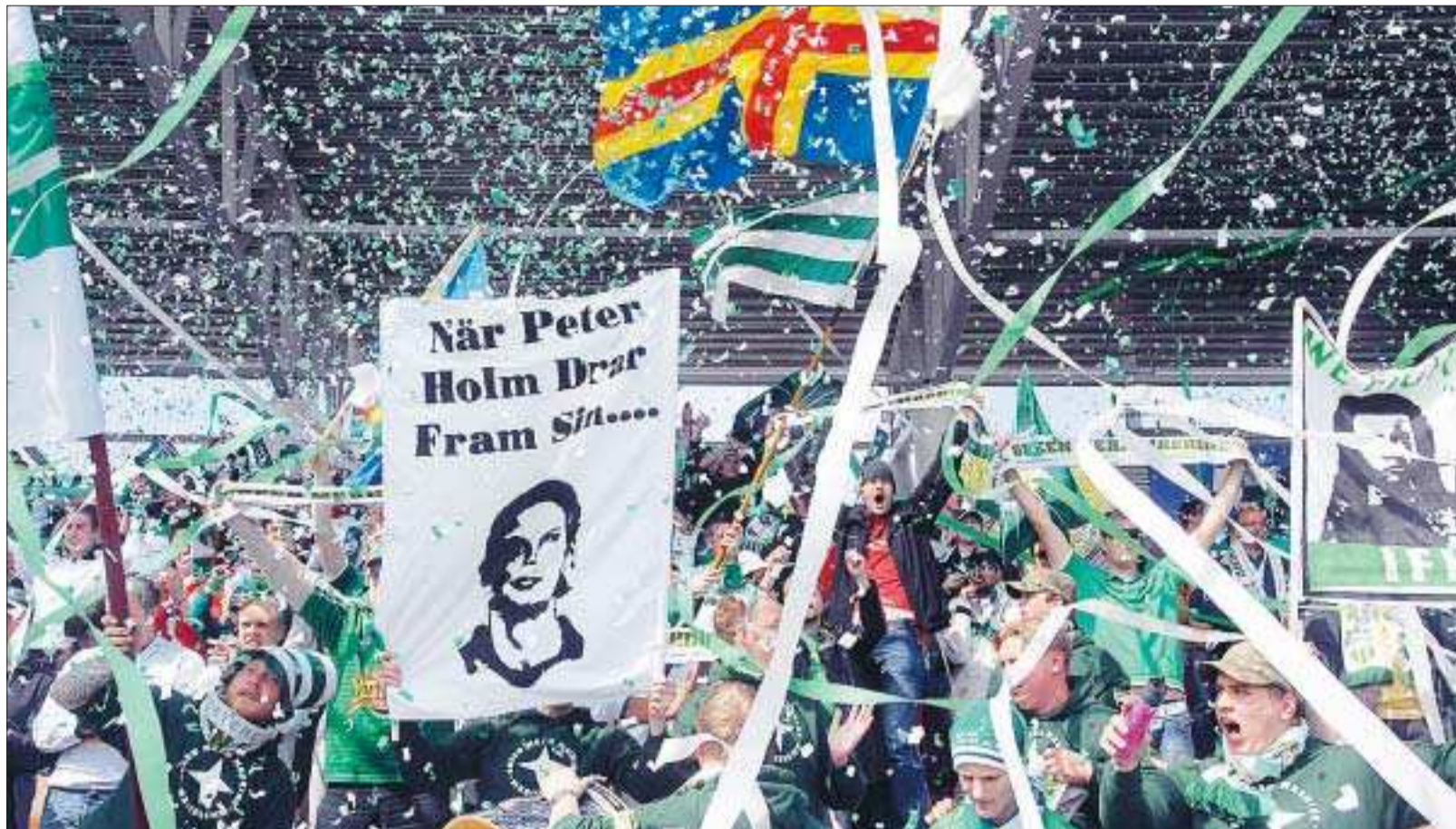
Folkfest 9 juni? Nej, bilden är tagen på en IFK-match, inte på Ålands självstyrelsedag. Någon folkfest, som Norges 17 maj, har dagen - ännu - inte blivit.

Å andra sidan – är man glömsk minns man inte heller bråk och oförrätter. Det måste ju kompensera en hel del.