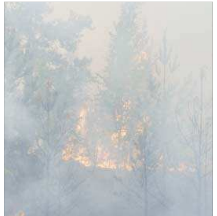
Rökigt. Röken låg tung över Lemland Knutsboda.