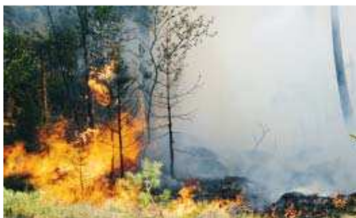
Eldhärjat. Närmare fyra hektar härjades av elden i Lemland Knutsboda igår kväll.