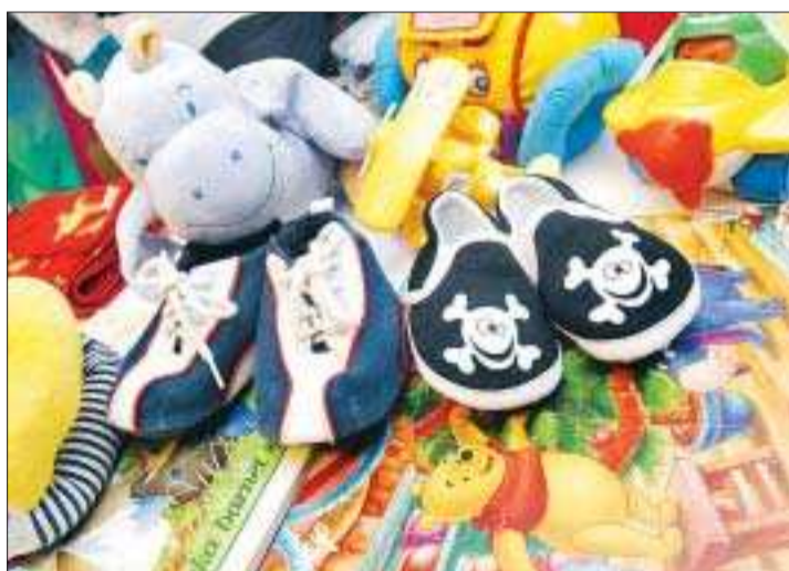
Något för alla. Här kan man fynda även för de minsta.

När? Tisdagar-fredagar 10.30-17.00 och lördagar 10-14. Var? Storagatan 15.