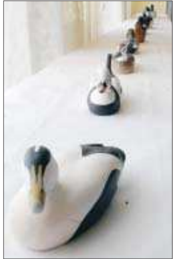
Synnöve Nordströms vättur ur den pågående utställningen form.ax.