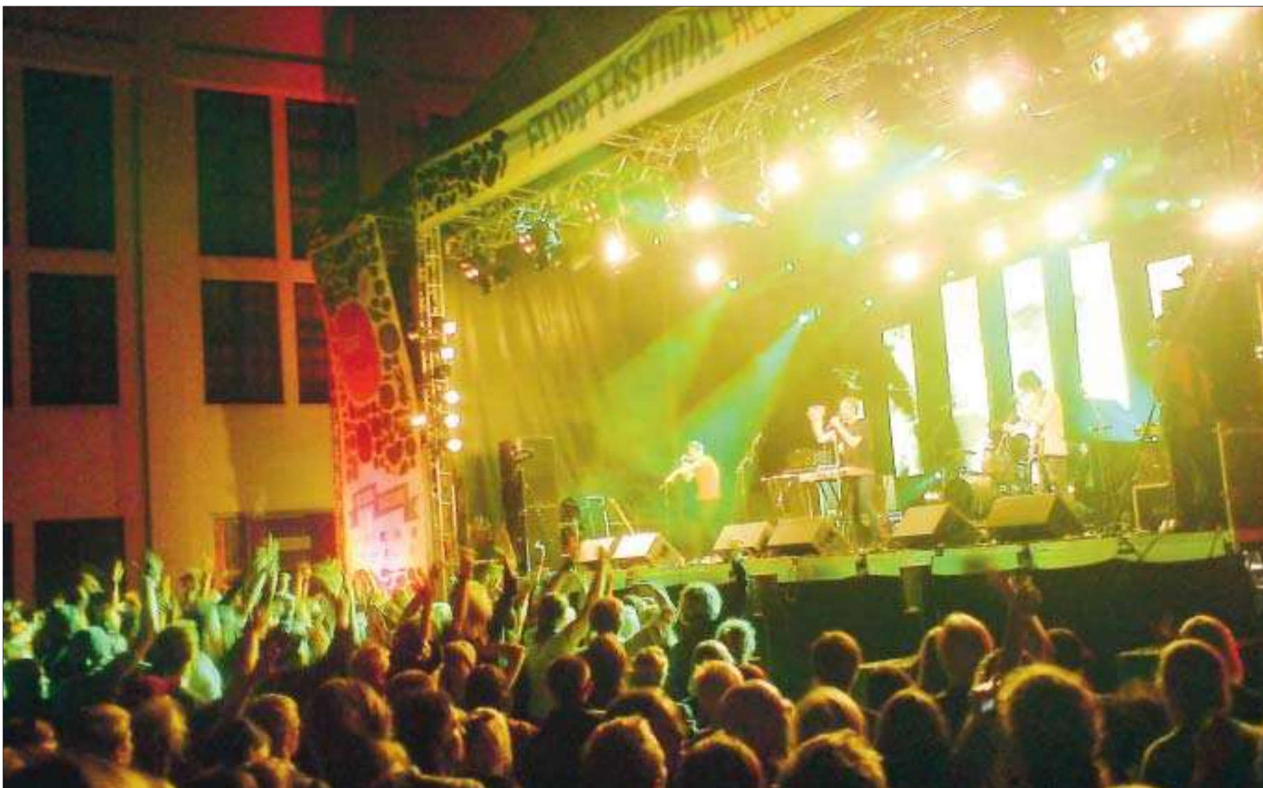
Publikrekord. Helsingforsfestivalen Flow slog publikrekord med hela 22.000 besökare. Ingen dålig ökning från fjolårets 13.000. På bilden har Cut Copy precis inlett festivalens sista spelning