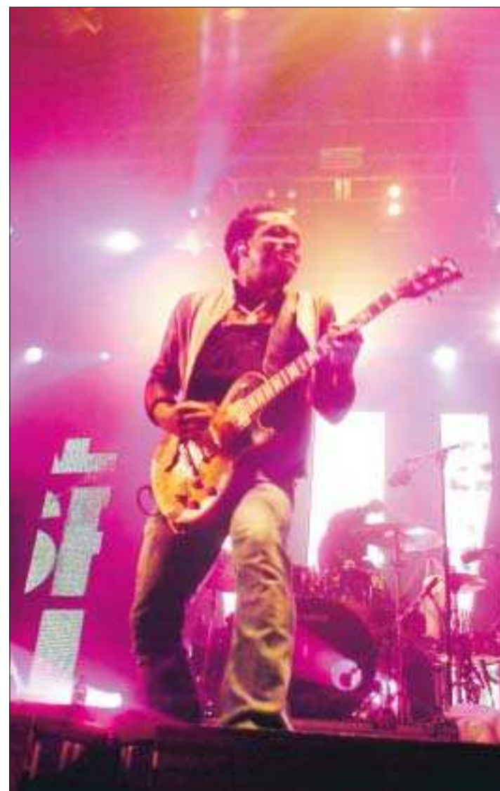
Rutinerade. The Roots vet vad en bra show innebär. Med tio års erfarenhet i bagaget kan de leverera en konsert som ingen annan.

På söndag kväll avslutar electropopbandet Cut Copy festivalen. "Det här är sista låten på festivalen, visa vad ni går för", skriker Dan Whitford. Publiken är helt med på noterna. När man vänder sig om och blickar bakåt så har hela festivalområdet blivit ett dansgolv.