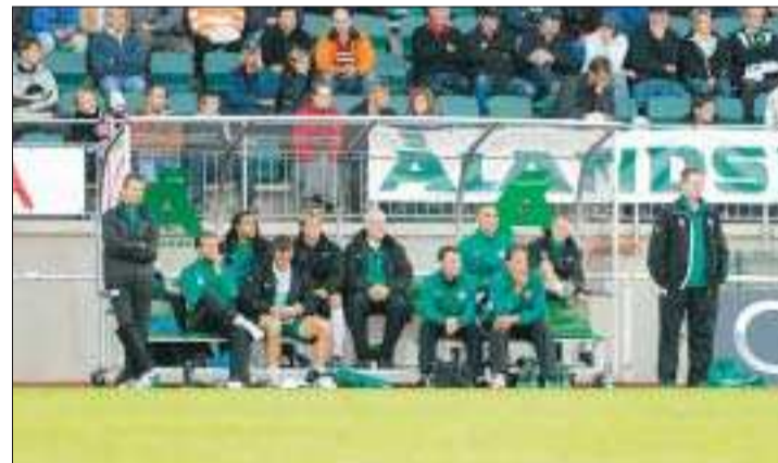
Dystert på kvisten. I matchens slutminuter var minerna på bänken allt annat än uppåt. Efter slutsignalen satt många av spelarna kvar på planen eller i båset men tomma blickar.