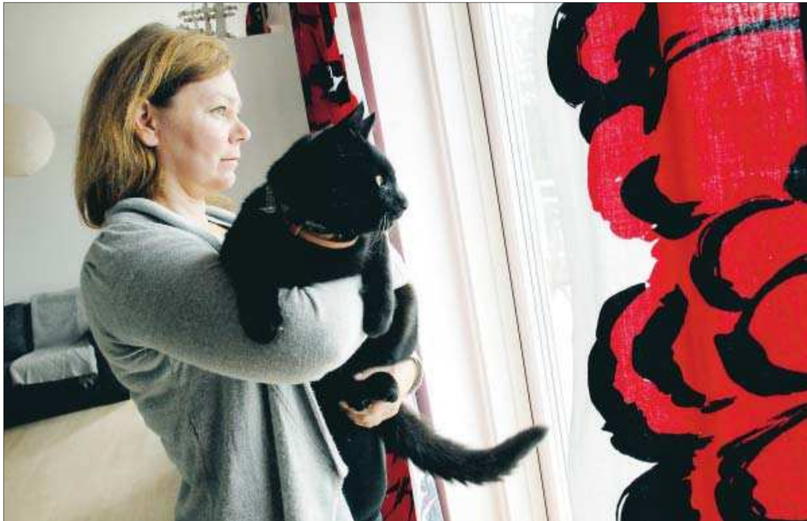
Hemlängtan. Katten Algot trivs inte bland byggställningar och krossgrus på Solberget. Han vill hem till landet och fågelkvittret i Gottby, även om han så ska gå dit för egen maskin.