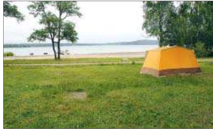
Attraktiv mark. Det finns mark i Mariehamn, menar insändarskribenten, och påpekar att campingplatsen används av tältare i 4-5 veckor per år.

Ett trist konstaterande är också att det har förstörts stora värden i gränsområdet mellan Mariehamn och Jomala. Det finns en del monument över dålig planering där attraktiva