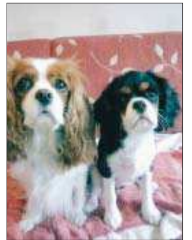
■ Vi träffas söndag kl 13 i Möckelö! Från 0457.