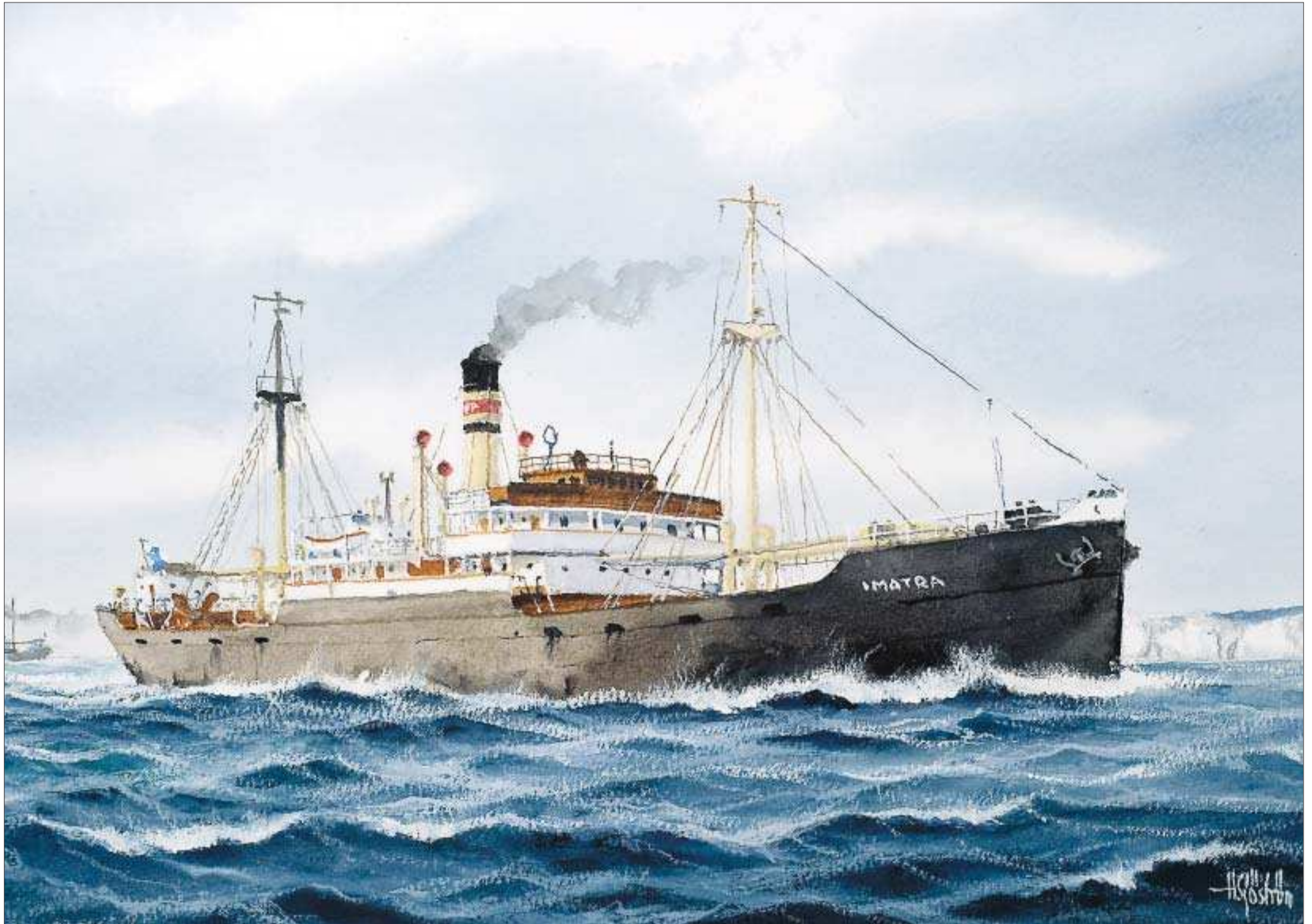
Låg på botten. I nästan sex år låg Imatra, eller Alcor som hon då hette, på botten av inloppet till hamnen i Hangö. När den nya ägaren kapten Paulin skulle till att bärga henne var det ett så komplicerat jobb att det tog mer än två år. Illustration: HÅKAN SJÖSTRÖM

När hon slutligen hamnade på Åland fick hon åter sitt originalnamn Alcor, som säkert de flesta känner henne som, och sedermera Sonja. Men hennes tid var då redan förbi.