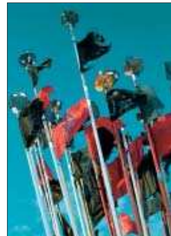
Laxflaggor. En doktorsavhandling ägnas åt laxstammen.

TORNEÅ. Vill man öka de naturliga laxstammarna är det effektivare att dra ner på fiske än att plantera fiskyngel.