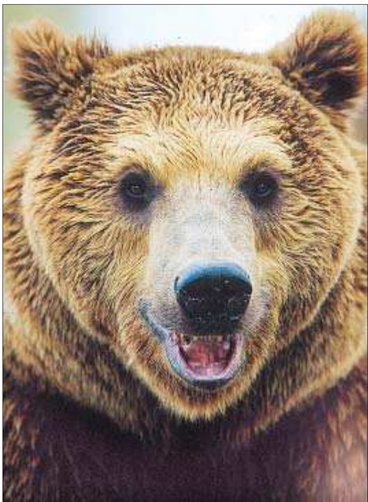
Mäktig syn. Den europeiska brunbjörnen är en mäktig syn - men den beundras bäst på avstånd.

Björnen är skygg – men den kan vara livsfarlig om den blir trängd.