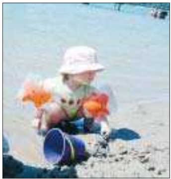
Marsundsstranden är Hammarlands allmänna simplats.