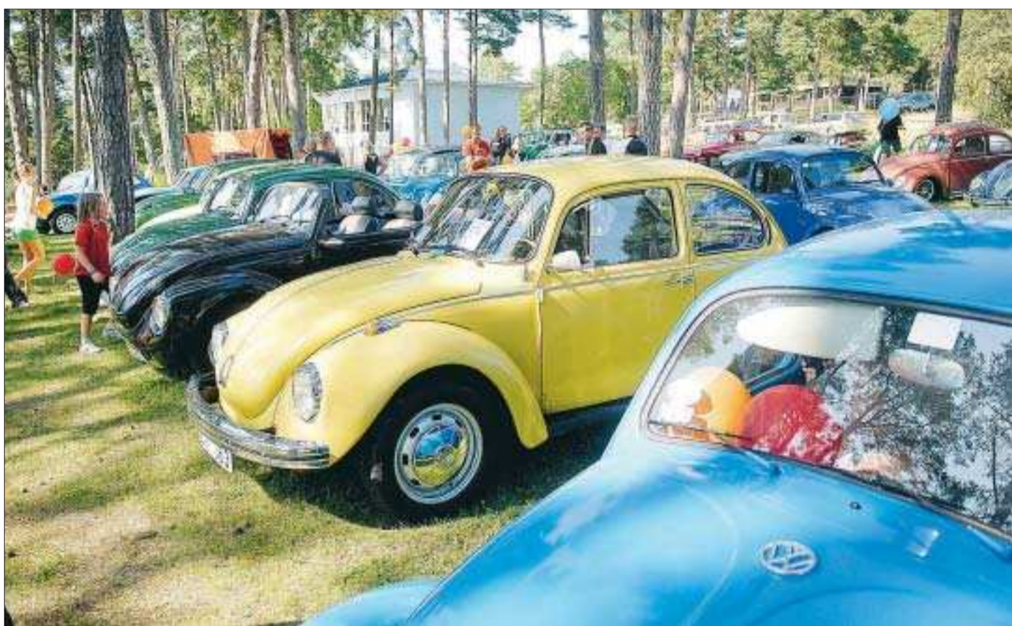
Kårt barn har många namn. "Folka", "Folkis", "Bagge" eller "Bubbla" är några smeknamn på dessa bilar som stod uppradade en efter en.

–Det är lite pill och jag gav väl ganska mycket för