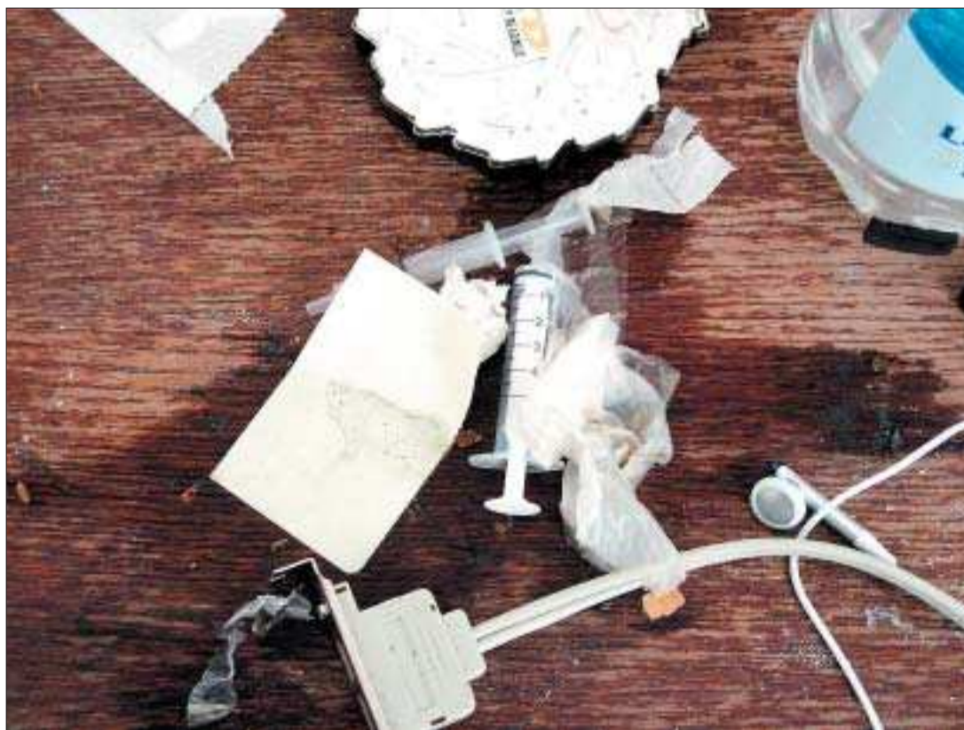
Ingen större omfattning. I torsdags rapporterade Svenska Dagbladet att två fall av efedrone-missbruk nyligen upptäckts på Åland. "Jag har inte hört att den förekommit i någon större omfattning" är polisens kommentar till förekomsten av drogen. Bilden är från en tidigare narkotikautredning.

Förutom akut manganförgiftning hör även psykos, avmagring, uttorkning, hallucinationer och risk för våldsamma aggressionsut-