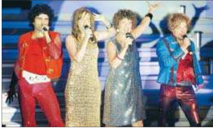
Dancing queen. Som sista nummer, innan överraskningsmomentet, bjöds publiken på en ensemble med Abba-låtar.