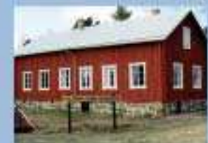
ÅLANDS SKOLMUSEUM 22 JUNI - 7 AUGUSTI mån - fre kl. 10 - 18