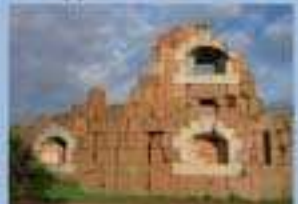
BOMARSUNDS FÄSTNINGSRÖNER ÖPPIET ÅRET RUNT