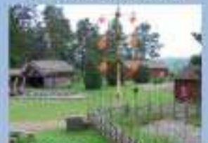
JAN KARLSGÅRDENS FRILUFTSMUSEUM 2 MAJ - 15 SEPTEMBER: dagligen kl. 10 - 17