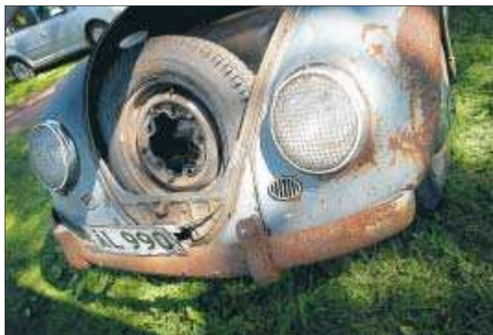
Rostiga. Rostiga liksom skinande blanka volkswagenbubblor stod uppställda i Badhusparken.