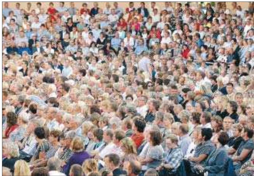
Slutsålt. Årets välgörenhetskoncert för ett friskare Östersjön sålde slut.