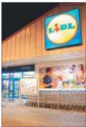
Inget Lidl till Åland. Lidl's utvecklingschef säger att Lidl inte kommer till Åland det närmaste året.