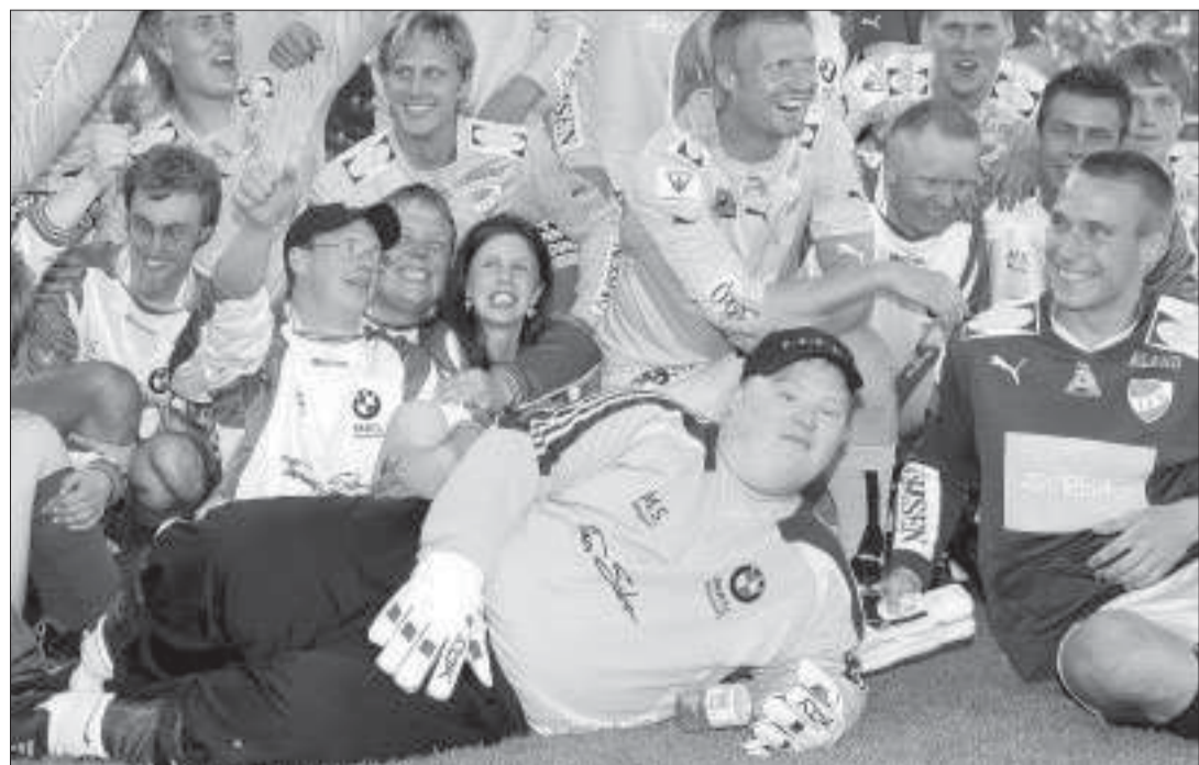
Tuffa matcher. Det har blivit oavgjort mellan DUV och IFK Mariehamn tre år i rad men förra året såg det länge ut som om DUV skulle vinna med 7-6. Dock lyckades IFK kvittera i slutet. Samtidigt har DUV vunnit samtliga tre straffläggningar ganska övertygande.

det är fantastiskt att IFK ger oss den här möjligheten, säger Löthman. Det är frivilligt inträde och caféet håller vi i.