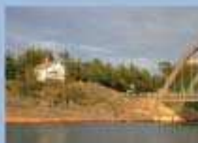
BOMARSUNDSMUSEET JUNI, AUGUSTI mån - fre kl. 10 - 18 JULI dagligen kl. 10 - 18