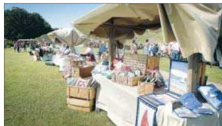
Hantverk. De traditionella ständerna med hantverk och dylikt gick att strosa kring och kanske fynda något handgjort ifrån.