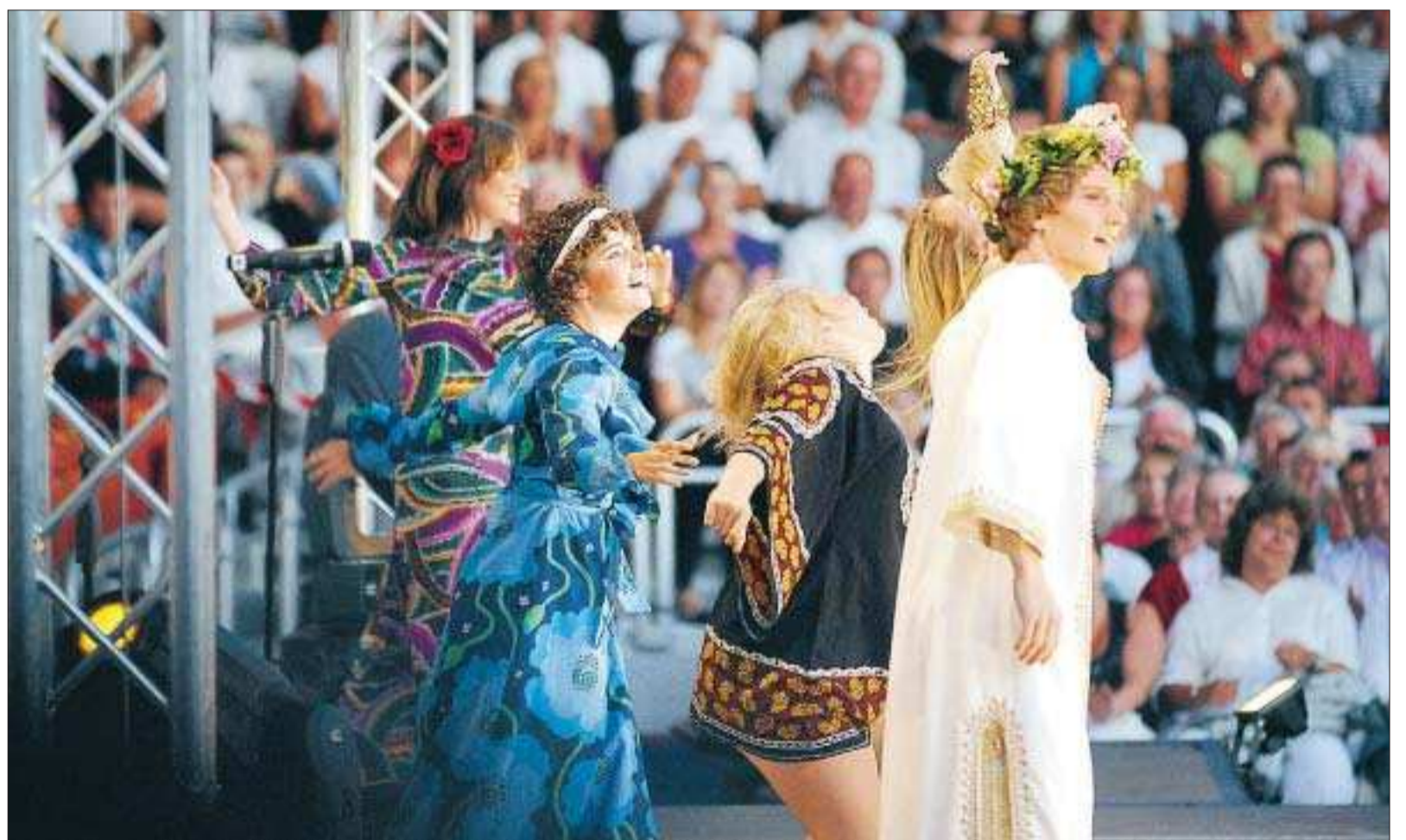
Röster för Östersjön. Kulturpubliken som satt på arenan i Andersudd i lördags kväll bjöds på en svängig och imponerande föreställning.

IFK Mariehamn vann för första gången på sju matcher när man slog RoPs hemma på Wiklöf Holding Arena med 2–1. Förutom tre poäng fick IFK dessvärre också tre spelare skadade, däribland lagkaptenen Mika Niskala . SIDAN 19