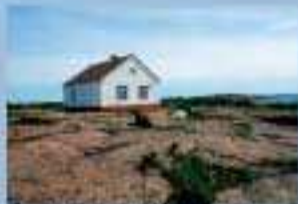
RÖDHAMNS MUSEUM 1 JUNI - 31 AUGUSTI (särskilt som Ålandska segelbåtarnas skärgårds- och Rödhamns)