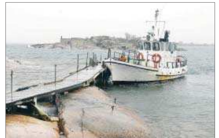
Har Gåsö gjort sitt? Behovet av färjtrafik i Mariehamns södra skärgård har minskat, understryker insändarskribenten.

På Askö flyttade de sista fastboende 2006 till Mariehamn. De flesta som har sommarstugor på Askö el-