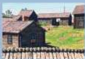
HERMAS MUSEIGÅRD ETT SKÅNGÅRDSHEMMAN I ENKLINGE JUNI - AUGUSTI mån - fre kl. 11 - 17