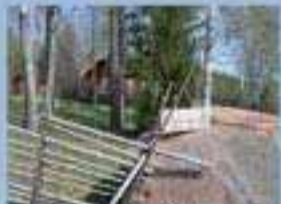
BORGBOGA FORNMINNESOMRÅDE med fäs släkt och vandringsstyg