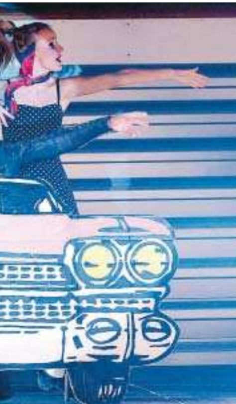
musikaltema. Framförde låtar ur musikalen Hair.