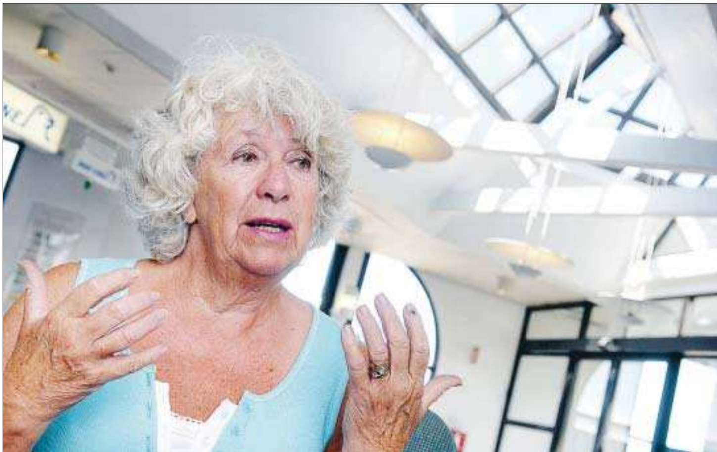
Motståndare. Maj-Britt Theorin gästade Åland och pratade om riskerna med kärnkraft.

Att kärnvapen är farligt är ingenting nytt eller chockerande, men kvantiteten kärnkraftverk måste öka betydligt