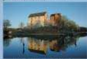
KASTELHOLMS SLOTT JUNI, AUGUSTI 1 - 15 SEPTEMBER dagligen kl 10 - 17 JULI dagligen kl. 10 - 18