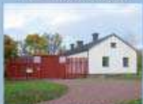
FANGELSEMUSEET VITA BJÖRN 2 MAJ - 15 SEPTEMBER: dagligen kl. 12 - 17