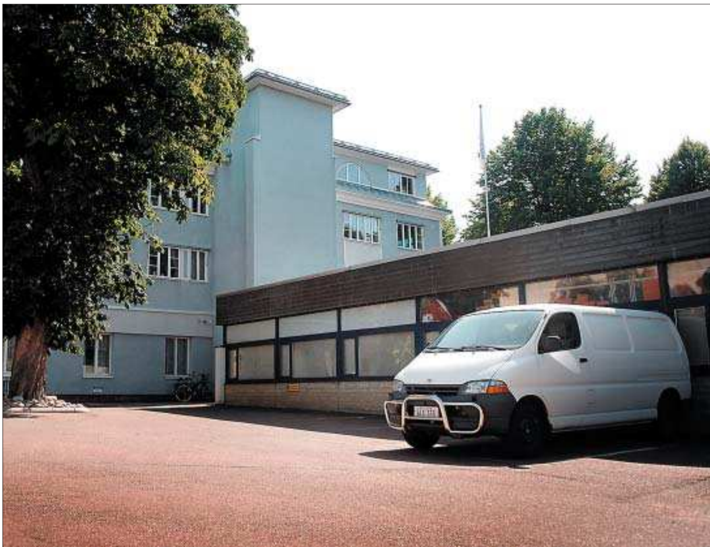
Platsen för våldtäkten. Den misstänkta våldtäkten ska ha ägt rum på Mega Sports bakgård i centrala Mariehamn natten till fredagen.

Har du rört dig vid Torggatan och Esplanadgatan vid tidpunkten för det inträffade, sett något eller har information som kan hjälpa polisen? Ring dygnet runt på tel. 018.527.100. (cl)