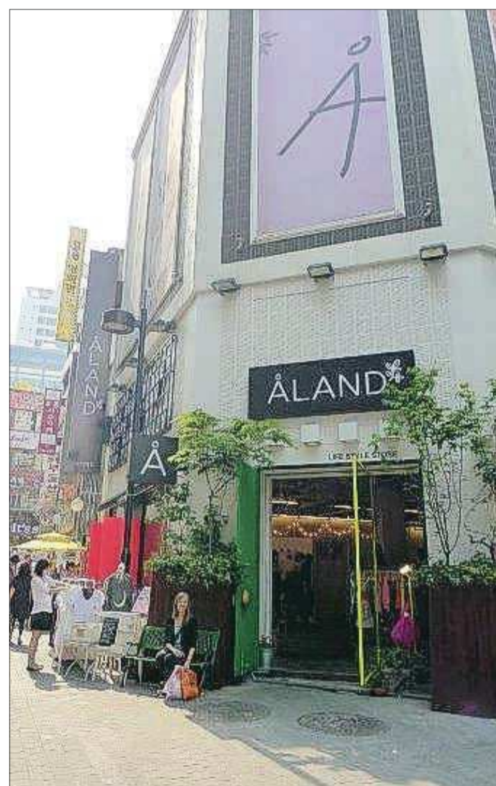
Ålänningen Ida Hilander framför butiken Åland.