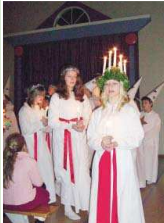
På Södersunda skola lussade man i fredags.