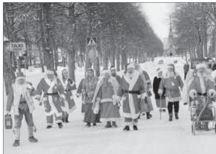
Massa tomtar. Tomten då? Improvisera det funkar! tipsar insändarskribenten.

Tomten då? Improvisera det funkar! En jul hade vi bekanta på besök med en gosse som var cirka 4 år. Vi konstaterade att vi inte hade tänkt på att det måste finnas en jultomte för klapputdelning. Jag löste problemet, gick