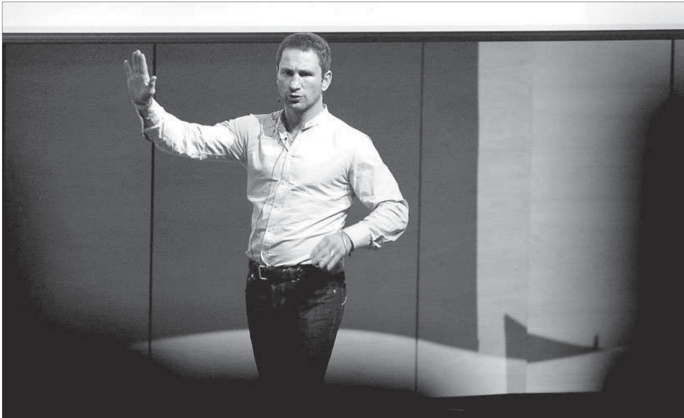
Alla kan. Alla kan leva sin dröm, bara de satsar fullt ut på den. Det sa Paolo Roberto i Alandica i fredags.