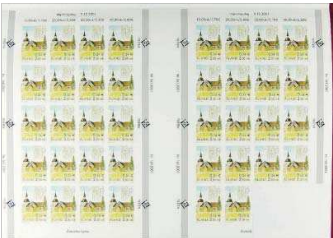
Drogs bort. Bland materialet som drogs bort fanns detta ark med Föglö kyrka.

Ätminstone ett märke från det nu aktuella materialet har dock troligen redan sålts. Ett objekt på Philea-auktionen är ett ark med 38 otandade märken med motivet Föglö kyrka från 2001. Arket ska innehålla 40 mär-