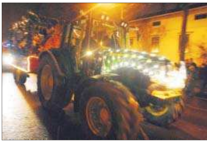
Partytraktor. Från den här färgglada traktorn skrålade rockiga jullåtar och på släpet dansade glada tomtar.