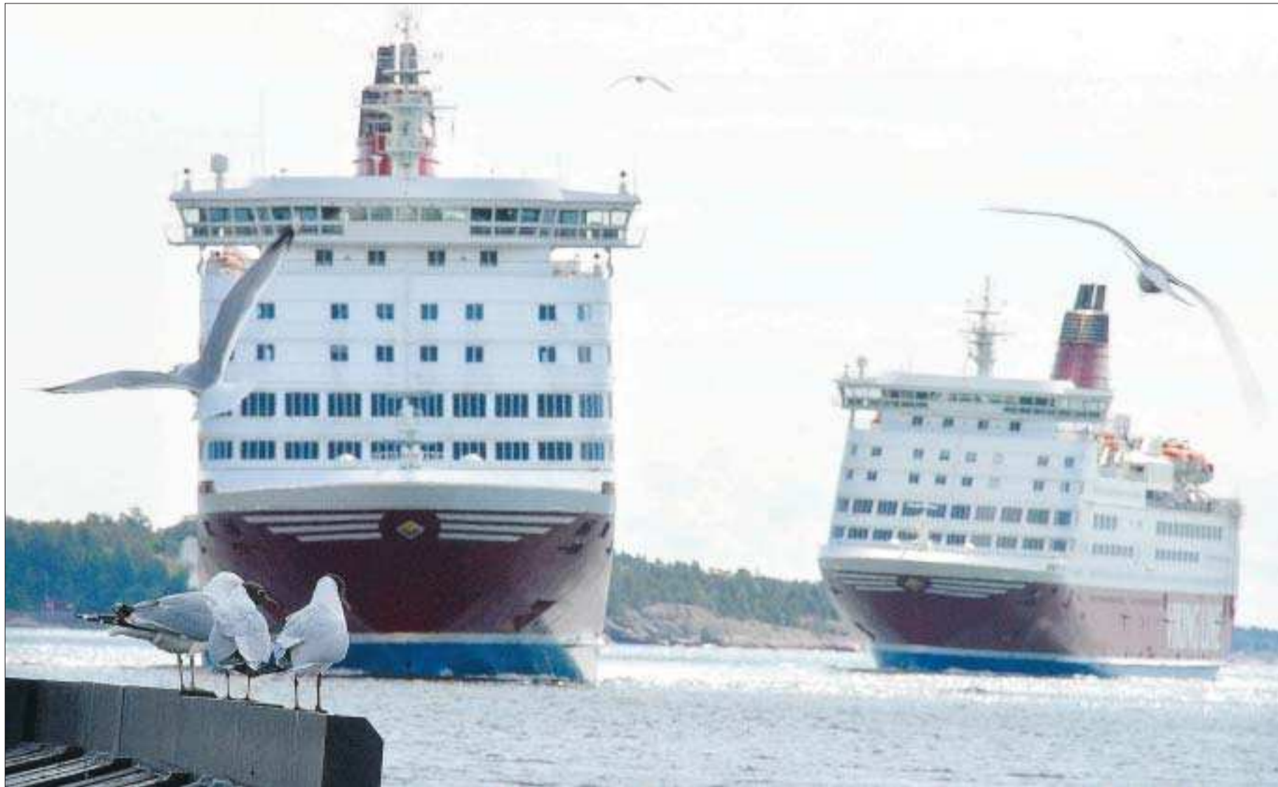
Gamla. Viking Lines fartyg har hängt med ett tag och snart lever de inte upp till miljökraven längre.