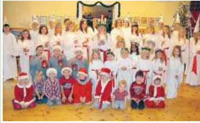
Överby daghem i Jomala, tillsammans med Vikingaåsens årskurs 6 jättefina luciataåg.