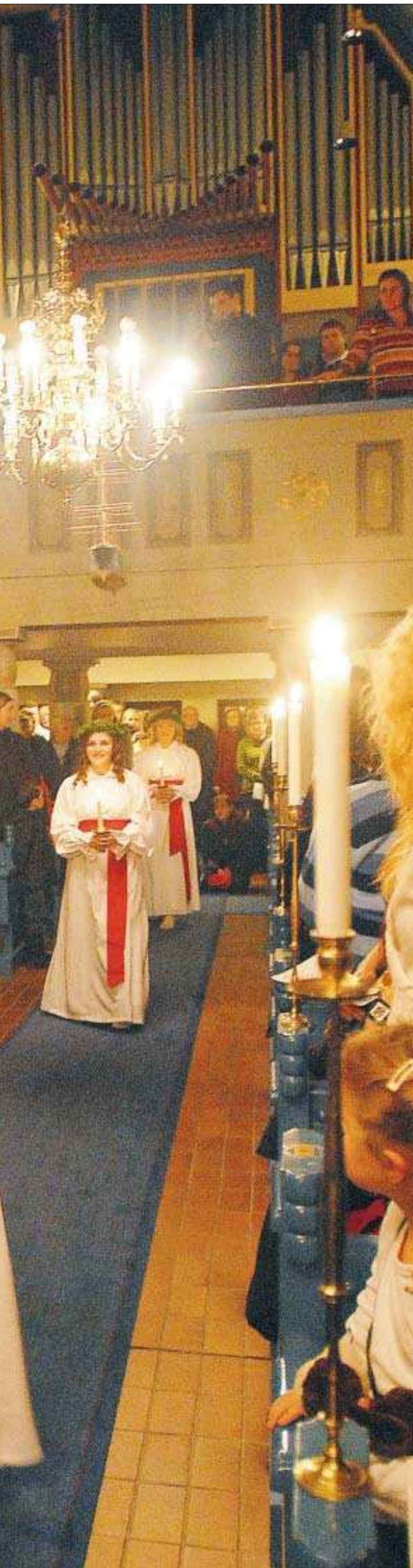
i det dystra decembermörkret.