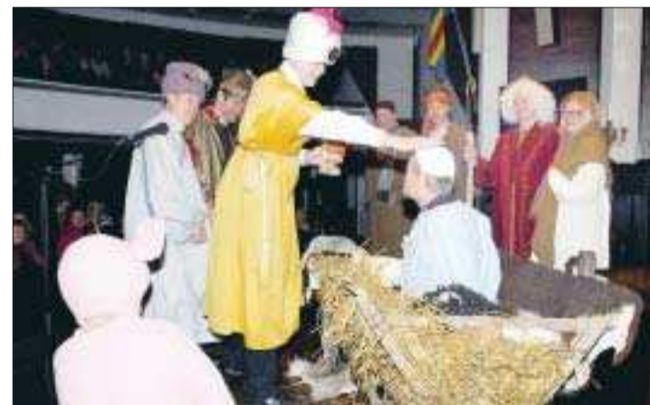
Kontrollerade äkthet. Till och med mössan är obunden, tyckte de tre vilse männen.