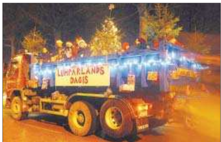
Dagistomtar. I Lumparlands dagis vagn var det full håll i gång.