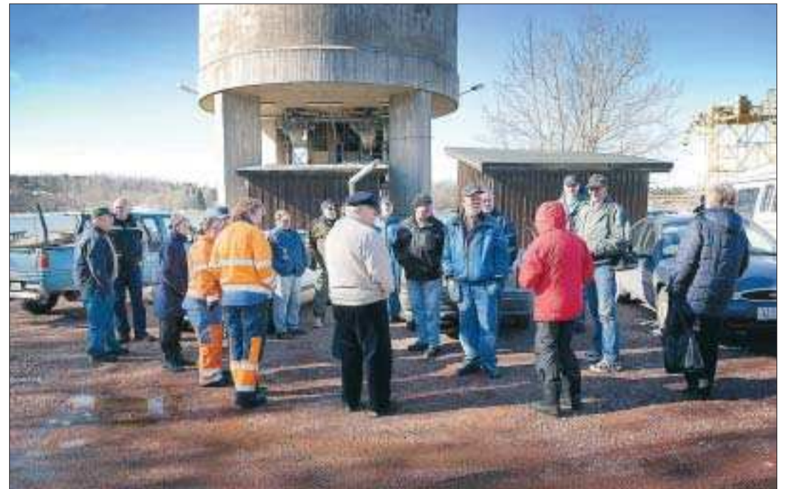
Enkät. I mars i år demonstrerade missnöjda Mise-kunder utanför kontoret i Mariehamn. Nu ska stadsborna snart få säga vad de tycker om rengällningsverksamheten.

I dag är stadens huvudspår att förändra Mise inifrån, men man