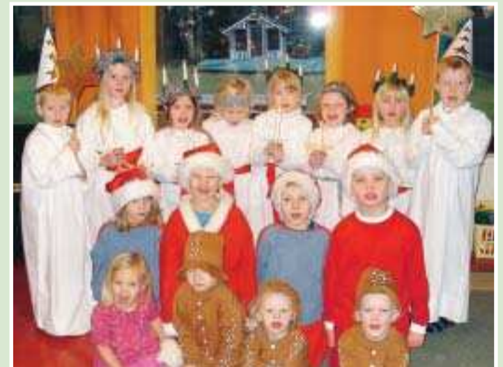
Hela luciagänget på St. Mårtens daghem i Mariehamn.