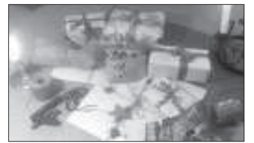
Klappat och klart. Behöver rimhjälp, mejla Åland 24.