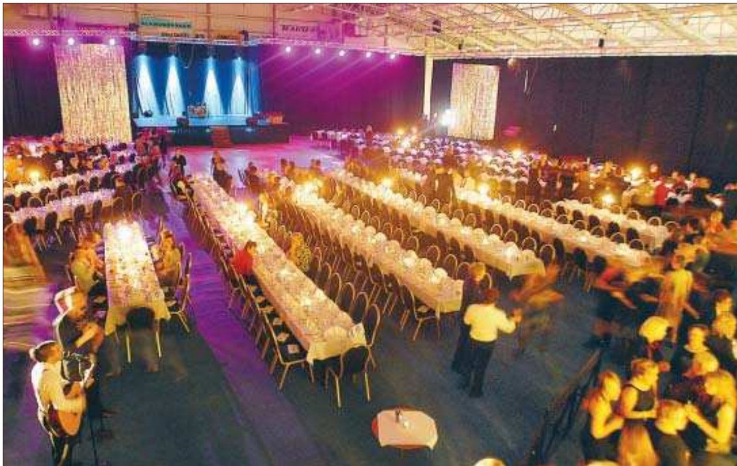
Dukat för fest. När staden inbjuder sina anställda till julfest har Arkipelag fått ge plats för Baltichallen som årets festlokal.