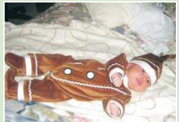
Första lussandet. Panumas Chomphu har tagit en bild på sin lilla pepparkaksgumma.